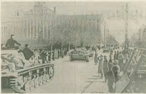
Τα στρατεύματα των ναζι μπιούνιο στο Βελιγράδι, στις 17 Απριλίου του 1941. Οι σημερινοί άγονοί τους, οι αμερικανοΝΑΤΟικοί στρατοκράτες, ονειρεύονται να κάνουν τα ίδια και χειρότερα...

Η δολοφονική ΝΑΤΟική επίθεση έβγαλε «τι άπλητα στη φόρα» τη «καθωρόπρη» πολιτισμένης Ευρώπης, που για όλους αυτών, το καιμυρολάριο του χαρακτήρα και