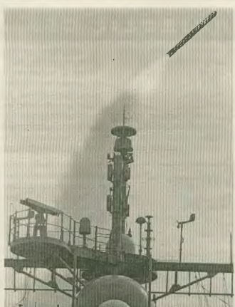
Πηγάδιος Τύναχος εκδοχέται από αμερικανικό πλοίο με προσηγμό τη Γιουγκοσλαβία. Η ελληνική κυβέρνηση έδωσε το «πράσινο φως» για την επίθεση

ντιπάλειμι την ιμπεριαλιστική «ερίση» με το πιστόλι στον κρατόρα. Το όποιο μειονοτικό πρόβλημα στα λυβών στα πλαίσια των σημερινών συνό-ρων από τους λαούς που κα-τακτούν σε κάθε χάρος, χωρίς ε-