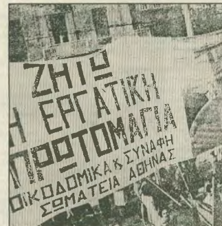
1975: Η πρώτη λεύκη Πρωτομαγιά μετά την πτώση της χούντας. Ο γιορτασμός της ανέπτυξε με τα τριάντα χρόνια την νίκης των λαών κατά του χιτλεροφασισμού

MAGUIRES», που κατηγορήθηκε σαν ένοχη μιας σειράς εγκλημάτων. Στη δική οι πραγματικοί θύματα των δουλοκρατών μετατράπηκαν σε κατηγορούς και δέκα εργάτες καταδικάστηκαν σε θάνατο, αποκενώθηκαν και μόνο για να τρομοκρατήσουν το εργατικό τάξη της χώρας, που είχε αρχίσει να να αγωνίζεται και να συνειδητοποιεί. Αυτό και μόνο άρκεσε για να πεσοθούν οι κίελοι των εργοδηγών ότι είχαν νικήσει οριστικά. Οι εργάτες μάχισαν με αντοχή για τη δολίση της πρώτης συνδικαλιστικής οργάνωσης των Αμερικανών εργατών και μάχιστο μεγάλο πολιτικό έπαισμα στο σημείο να υποστηρίξουν ότι η εργατική τάξη έπρεπε να τεθεί υπό τον φερό ελεγχό των αρχών. Ταυτόχρονα, ρίχτηκε το σύνθημα να «πατηθούν περισσότερο». Η Εταιρεία των Σιδηροδρόμων