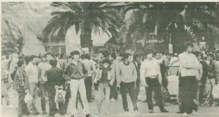
Μετανάστες στο κέντρο της Αθήνας περιμένοντας να βρουν δουλειά