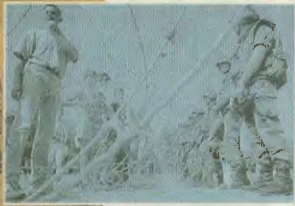
Οι ΑμερικανοΝΑΤΟϊκοί επιχειρήματα υψώνουν οδοφράγματα και «επιτηρούν» την τάξη, υδαφορούν όμως μπροστά στα φλεγόμενα σπίτια των Σέρβων

Βαλκάνια, την αριχή και την αλληλεγγύη που επιβάλλεται να εκφραστούν εμπροκτα στο σερβικό λαό.