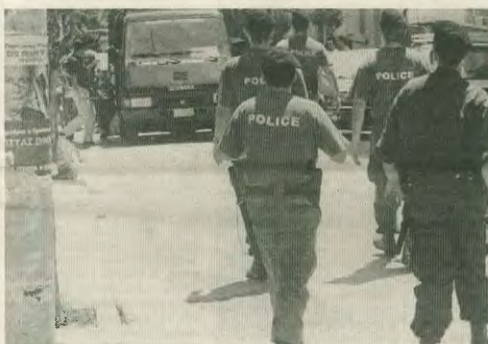
Στημιμύηση από επιχείρηση - «οικίστα» της Αστυνομίας κατά οικονομικών μεταναστών

Αθήνα, δεν γνωρίζει η κυβέρνηση τις δια- πλοκές που νιώνται στα σύνορα. Δεν γνωρίζει ποια φέρνουν στην Ελλάδα την κόκα, την πρω- λη, το χαχός. Ποια βρίσκονται πίσω από την προ- λη στην Ελλάδα οι σύγχρονοι δολοφόροι διά Ήρας, αέρα και θαλάσσης; Η καταγωγή Αλβα- νίας από την Τζεζαίρα, ότι το Γεωγραφικό της καταγωγής κατάβηκε από την Κακαβιά μέσα στα πορτογαλικά μετατόχους, κοινοβουλευτές. Καμία απάντηση - τολμώντας επίσημα, δεν έ- δωσε το Υπουργείο Δημόσιας Τάξης. Ο κατα- γωγικός καταβήκε σε προεδρίες μας και προ- ξενία είναι καθημερινές, όμως η κυβέρνηση κρατά ένοχη σιγή γι' αυτό.