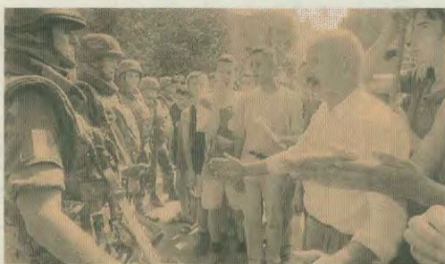
Αλβανοί του Κοσοβό υπόλογοι τους Γάλλους στρατιώτες στην πύλη Μιτρόβιτσα