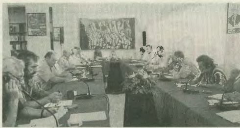
Από τη σύσκεψη στην Ομοσπονδία για την ειρήνη στα Βαλκάνια