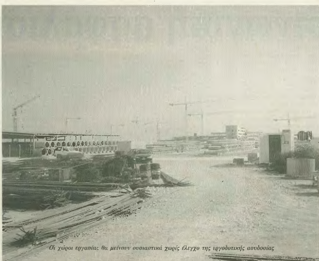
Οι χώροι εργασίας θα μείνουν ουσιαστικά χωρίς έλεγχο της εργοδοτικής αυθωσύας

2. Η εγκύκλιος τολμά ότι θεωρείται σκόπιμο να ειδοποιείται ο εργοδότης εκτός των περιπτώσεων που η παρουσία του θα βλάψει την αποτελεσματικότητα του ελέγχου. Αυτό σημαίνει ότι ο έλεγχος όπως επιβάλλεται να είναι οφθαλμικός, ώστε να