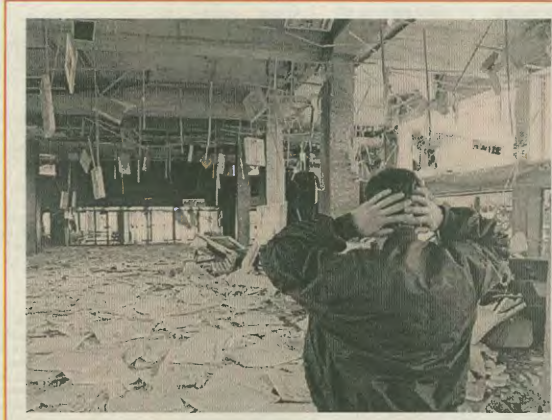
Απόγνωση μπροστά στην καταισθητή του ακόρπωση τα βομβαρδιστικά του ΝΑΤΟ

ναί πιο επικόμο από ποτέ και με δε συμπόλιους άστυ να μην πρόδω». Στη ομιλία του ο συνδεδεμένος αναεπάρκειες στις τραγικές συνθήκες που επέφερε για τους λαούς η ανατροπή των σοσιαλιστικών καθεστώτων, έκανε μια αναδρομή στην εκλημτική δράση των ιμπεριαλιστών και του ΝΑΤΟ στα 50 χρόνια ύπαρξής του, καθώς και στους στόχους τους, μεταξύ των οποίων ανέφερε το μοιραίο των αγορών και των σφοδρών επιρροών, την πλήρη υποστή των λαών, τη δημιουργία κενών προεκτατορών, την άσκηση των εδαφών της πρώην Σερβικής