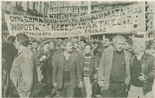
Οικοδόμοι (πάνω) και μαθητές (κάτω) έκαναν μια διαδήλωση στις 11 του Νοέμβρη στο κέντρο της Αθήνας

Κατό τη διάρκεια της απεργιακής κινητοποίησης στις 11 του Νοέμβρη μετά το πέρας της αυγινής κίνησης οι Οικοδόμοι βρέθηκαν στο πλευρό των εργαζομένων μοβήτων, ομίχμα μαζί με το