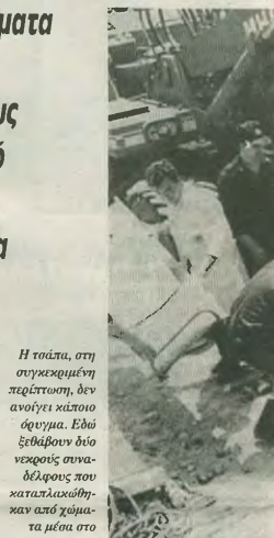
Η τάπια, στη συγκεκριμένη περίπτωση, δεν ανοίγει κάποιο όφνημα. Εδώ ξεθάβουν δύο νεκρούς συνάδελφους που καταπλανώθηκαν από χωμάτινα μέσα στο χωμάτινο

Είναι άσπυρο πλέον ότι στο χώρο της οικοδόμησης και των τεχνικών έργων είναι μια μεγάλη απειρία και κατασκευαστικά τεράστια έρρα, μεγάλα