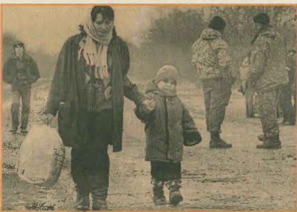
Όπως πάντα οι άμαχοι πληρούντα τα απαιτήματα

Κονό και στις δύο χώρες ότι ο Πρόεδρος της Αρμενίας και του Αζερμπαϊτζάν Καρσζακίαν και Αλίβαρ, αντίστοιχα, που έμειναν εν ζωή, συμφωνούν με τα αμερικανικά σχέδια. Τα σχέδια αυτά βέβαια δεν προέκυψαν από τη φιλανθρωπία των ΗΠΑ, για να λύσουν τη χρόνια αρμενο-αζερμπαϊτζανική διένεξη. Στόχοι τους είναι άλλοι και συγκεκριμένα: Ο Έλεγχος όχι μόνο των πλουσιότερων κοιταγμάτων πετρελαίου της Κασπίας και του Καυκάσου, αλλά και των δρόμων μεταφοράς τους προς τη Δύση.