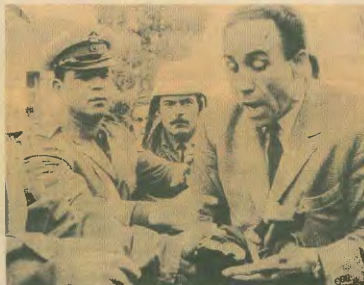
Η Χωροφυλακή προσπαθεί να ισοπεδώσει τον βουλευτή της ΕΔΑ Γρηγόρη Λαμπράκη να πραγματοποιήσει την πορεία Ειρήνης, έναν μήνα πριν τη δολοφονία του

Η απόφαση εισαγγελέα και ανακριτή για την προφυλάκιση όλης της ηγεσίας της Χωροφυλακής στη Β. Ελλάδα στράφηκε σε ατρόμητα στοιχεία που αποδέχονταν ότι ο Μήτσου και οι υπάλληλοί του μόνο γινάζονταν τα σχέδια για τη δολοφονική απόφαση κατά το Λαμπράκη, αλλά συζητούνταν και στο σχεδιασμό της, μέσω των παρακρατικών οργανώσε-