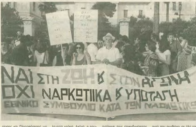
Προβόλος και πληροφόρηση για το Ναρκωτικά και την Τοξικομανία (ΕΚΕΤΕΠ). Στη χώρα μας η κίνηση κάνει ερώτηση. Είναι η πλέον διαδεδομένη ουσία χρήσης στα μεσοτόκια και γενικά πληθυσμού και η χρήση της τοξικοκατάσχεση τα πέντε τε-

Τις ίδιες μέρες δημοσιοποιήθηκε η έκθεση για το 1999 του Εθνικού Κέντρου Τεκμη-