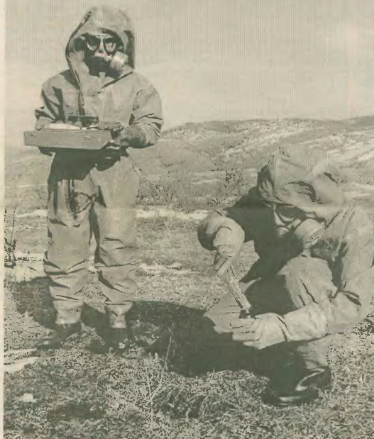
Γιουγκοσλάβοι στρατιώτες ερευνούν με ειδικές ανασκευές την υπαθή ραδιενέγεια σε περιοχή που επλήγησαν από τις βόμβες των «αεροποριών» του ΝΑΤΟ

Αλήθεια! Μήπως δεν είναι η ίδια η πολιτική των μονοπωλίων, των ιμπεριαλιστών, που σκοτώνει; Με σένα ή βίαια σένα; Περί σε σ' αλήθεια πεθαίνουν καταθνήσιμα από την οικονομική εξάρτηση; Πόσο από κοινή διατροφή (Γεωργία αγελάδες, διαίτη, ορνίθια, χρωματίες ουρίες, μεταλλένια προϊόντα), αλλά και τη μόλιση του περιβάλλοντος; Πόσο από ναρκωτικά, από έλλειψη υγιεινών φαγητόφρων αλλά και τους άλλες δίαιτες, σύμφωνα του καπιταλιστικού συστήματος; Γίνεσαι, λοιπόν, ολόκληρο ότι ιμπεριαλιστική πολιτική και ιμπεριαλιστικός πόλεμος δεν είναι παρά οι ίδιο όψεις του ίδιου νοσήματος. Όσο όμως σημαντικό και να γοητεύονται το πνεύμα, άλλο τόσο σημασία έχει οι υποταγόμενοι σήμερα ότι. Δεν είναι μόνο η επικινδυνότητα της έ-