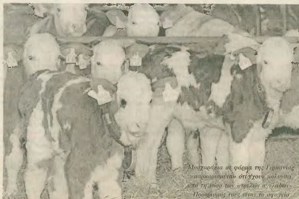
Μουσουλιά σε φάση της βιομηχανικής παραγωγής από ζώων, παρδί και το ήμισυ του «τρέλαν αγελάδων». Παραοικονίς τους είναι το σφαιρίνη.

Α κανείς θέλουν να αναζητήσει τις αιτίες του πρόβλημα που λέγεται «τρέλες αγελάδες», θα ακουθούν μεμιάς πάλι στον «άρα-αυτο» νόμο της ΕΕ, τον 1991, που κέρδους. Εδώ βρίσκεται η βασική αιτία του δράματος των «τρέλαν αγελάδων» και του διαποικιο τρόμου για τους ανθρώπους. Κι εδώ βρίσκεται η αιτία για το 15 χρόνια τώρα δεν επιβίβει παρδί κανένα υγιονοπιστήν μέτρο ε-έλεγχης της νόσου και ενημερωμένης προοδός των καταναλωτών, στην ε-έλεγχος της ΕΕ. Ο καταποικιο τρόπος ανάπτυξης της κτηνοτροφίας, στα πρότυπα των ΗΠΑ, η υπαγωγή στους ψυχρούς νόμους της ελευθέρης αγοράς και στις κερδοσκοπικές αξιώσεις των πολυεθνικών, που έχουν επιβάλει ένα κακόβαστο μονοκολλητικό ζυγκλας, επικράτησαν έναντι της υ-