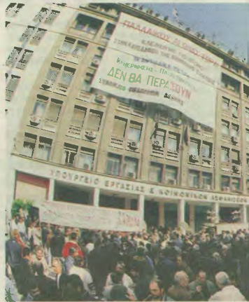
Λιανή απειλή κατά 7 συνδικαλιστών του ΠΑΜΕ, γιατί - λόγω της συνέχισης της διαίτησης αδονιών, όπως και Η λογιστή του τρομονόμου τίθεται σε ισχύ, αμύσης μετά την ψηφίση, όσος νομίζον ότι με αστυνομικό κράτος θα

Χρέος κάθε εργαζόμενου, χρέος κάθε δημοκρατικού σκεπτόμενου ανθρώπου, κάθε ανθρώπου που θέλει να ζει με αξιοπρέπεια, είναι να αντισταθεί, να μην αφήσει την κρατική τρομοκρατία να περάσει.