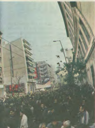
- το αναγκασμένο πανό δείχνει τους αναγκασμένους οικονομικούς αστυνομικούς του Τμήματος Ομοειδών, η μη του σε στεγνάγια ΠΑΣΟΚ και ΝΔ. Είναι γελαρισμένο, κεντρικόν να αντιμετωπίσουν τον «εχθρό λαό».