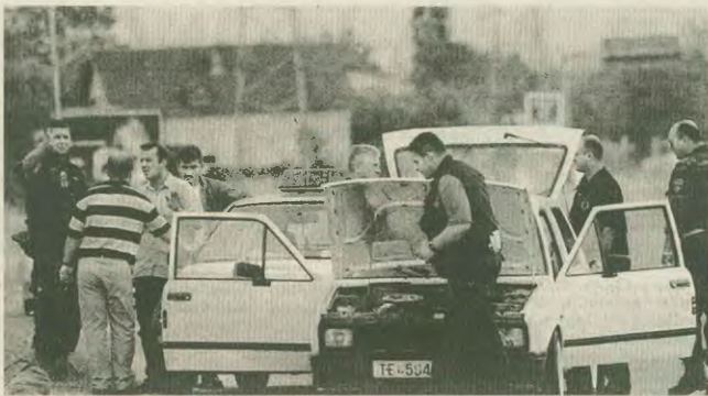
Αυτονομιστές της ΠΓΑΜ ελέγχουν διεκδικημένο όχημα για όπλα, έξω από το Κουμινόβο

Σε κάθε περίπτωση, πάντως, όπως καταλήγει στα συμπεράσματα της (conclusion) η έκθεση της συμμαχίας, καθώς η παρούσα κατάσταση δεν μπορεί να συνεχιστεί και μια μελέτη της στρατιωτικής κλιμάκωσης δράσης δεν είναι εφικτή, η FYROM πρέπει να πετύχει μια πολιτική λύση, ικανοποιώντας τα περισσότερα από τα αλβανικά αιτήματα, εμποδίζοντας τον ΝΛΑ να κερδίσει σε αξιοπιστία από τη δράση του.