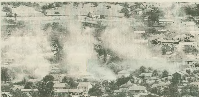
Το Αρατσινοβό στις φλόγες, κατά τη διάρκεια συγκρούσεων του στρατού της ΠΓΑΜ με τους αλβανόφωνους

Στο πρώτο με τον τίτλο «Περίληψη λύσεων» (Overview) παρουσιάζεται η εικόνα που η συμμαχία έχει διαμορφώσει παρακολουθώντας με τις υπηρεσίες της τις εξελίξεις. Από αυτό το τμήμα της έκθεσης, που καταλαμβάνει δύο σελίδες, οφείλει να εσημανθεί ότι για το ΝΑΤΟ η από τον συγκρούσαν ξεκινά από τη διαθεσιμότητα της πολυπληθούς αλβανικής μειονότητας να διεκδικήσει τα δικαιώματά της. Ο διαπιστωμένος κάθε προσπαθεί δράσης κα-