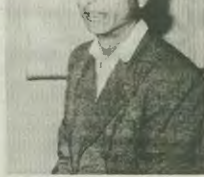
Γρηγόρη Λαμπράκη. Οπως, ο ίδιος ο Εμμ. Εμμανουηλίδης, σε συνεντεύξη του στην εφημερίδα «Πρωτό», λίγο πριν αυτή κλεισθεί, είχε ισχυρηθεί ότι δεν ήταν αυτός ο δολοφονός και ότι τη στήμη του έφτασε

Μαζ με τον Γκαζτώμδη και σύμφωνα με τη δικαστική απόφαση, φέρεται ότι και ο Εμ. Εμμανουηλίδης δρασκώσαν πάνω στο τρικύκλο και με το λώσο σκόκοτε τον