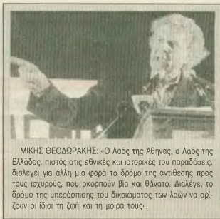
ΜΙΚΗΣ ΘΕΑΔΟΡΑΚΗΣ: «Ο Λόος της Αθήνας, ο Λόος της Ελλάδας, είναι της εθνικής και ιστορικής του παράδοσης, διάλεξε για άλλη μια φορά το δρόμο της αντίθεσης προς τους ισχυρούς, που σκοπεύουν βία και θάνατο. Ανάλεξε το δρόμο της υπεράσπισης του δικαίου των λαών να ορίζουν οι ίδιοι τη ζωή και τη μοίρα τους».