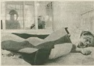
Ο Μπιν Λάντεν μεταμορφωμένος. Καλά να πάθει...