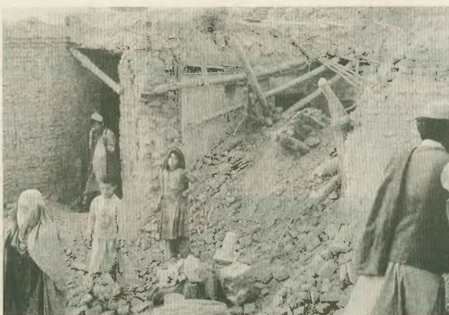
Γκαρμονιμένα σπύια στην Καμπούλη. Η τρομοκρατία των ΗΠΑ και των Ευρωπαίων ενάντια στα πλανήτιστα

Υ) Στις 28 Οκτώβρη, ο υπουργός Άμυνας των ΗΠΑ, ο Ν. Ράμσφελντ, παρουσίασε τη Συνέδση των υπουργών Εξωτερικών της ΕΕ, δήλωσε σε μια πρωτοφανή επίδειξη της «υποπάθεσης» των παγκόσμιων γκάνγκστερ: «Στην ιστορία τους, οι ΗΠΑ -από τον Ράμσφελντ- δεν απέκλειαν ποτέ το ενδεχόμενο να κάνουν χρήση, πρώτες αυτές, του πυρηνικού ο-