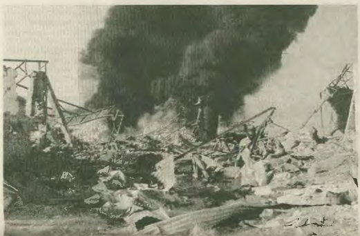
Πηγαγιά στις αποθήκες του Ερυθρού Σταυρού, μετά από αμερικανικό βομβαρδισμό. Εδώ μάλλον κρύβεται ο Μπιν Λάντεν...

μεία είτε της περιοχής μας, αλλά και ευρύτερα του πλανήτη», όπως ωμά αποκάλυψε ο Γ. Παναπαντοίου, επισημαίνοντας ότι «όλοι εμείς οι Ευρωπαίοι, οι Αμερικανοί και οι άλλοι συγκροτούμε τη μεγάλη αλληλεγγύη εναντίον της τρομοκρατίας, θα πρέπει να προετοιμαζόμαστε για έναν μακροχρόνιο αγώνα, που θα έχει σαν αντικείμενο την εξάρθρωση αυτών των τρομοκρατικών δικτύων...»