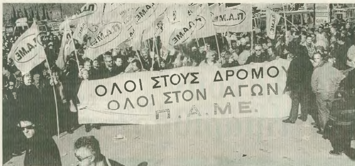
Η Ομοσπονδία καλεί τους οικοδόμους να εκφράσουν τη συμπάθειά τους στη μαχημένη αγροτιά με κάθε τρόπο και μέσο