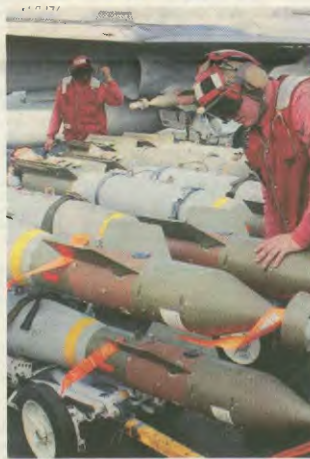
Οι Αμερικανοί ετοιμάζουν πυρηνωδώς τα «όπλα», για την «επίθεση φίλιας» στο λαό του Ιράκ