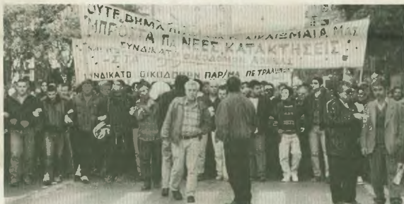
Οι εργαζόμενοι θέλουν δημαρχοὺς κα νομάρχους, που θὰ ἀνταναῖστο στο πλευρὸ τους κα θὰ ἀμειψοῦνται στους ἀγώνες τους

μᾶζα τὸ λαὸς, στους χαιροδῆμο, ἔπαιθε, στις φηροσποῦ, ἀπὸ τὴν ἀνεργία, στους ἀγώνες των παθῶν κα για μισροφῶ, στις μεγαλῆς ἀντιμπεροματικῆς διαδηλώσεως κλπ. Ὑπάρχουν δυνάμεις που συνειδητοῦν γινόντα μεγαλῆς ἐπιθέσεως των ἀμειψορῶν τῆς ἀνεργίας τῆς, που ἀποδοχῆ τὴν κυβερνητικὴ πολιτικὴ δὲν τὴν ἀποκαλύπτουν, ὅλα τὴ ἀποδοχῆ, που στην προῆτικὴ ἀνεργία τῆς αἰτες γέννησης των προβλημάτων, ἀρα κα τὰ ἴδια τὰ προβλήματα.