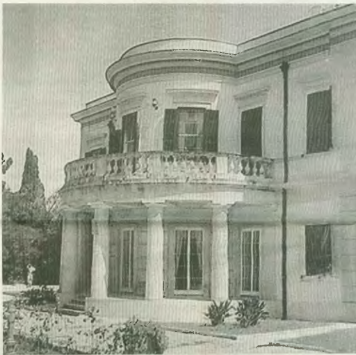
Μον Ρεπό: Μέρος της αρχαιολογικής ανάλυσης της οικογένειας έγινε και από εδώ στο Τατόι

Το πρώτο που πρέπει να κρατηθεί λοιπόν είναι ότι δε γνωρίζουμε αν και τι έβγαλε στο εξωτερικό ο Κωνσταντίνος από τις αρχαιότητες που είχε στο χέρι του. Το δεύτερο είναι, πόσες και ποιες είναι συνολικά αυτές οι αρχαιότητες. Το τρίτο αποτελεί ερώτημα: Γιατί δεν ολοκληρώθηκε η καταγραφή που ξεκίνησε το '91 από την Αρχαιολογική Υπηρεσία και γιατί δε ξεκίνησε νέα καταγραφή από τις επόμενες κυβερνήσεις. Όσο κι αν είναι προληπτικό για τις «ανασχές» - «ανασχές» της σατικής κοινότητας της «πολιτικής» και αποτελεί τον «μυσούλο» για τις συγκρίσεις που θα γίνουν σήμερα, αν βέβαια