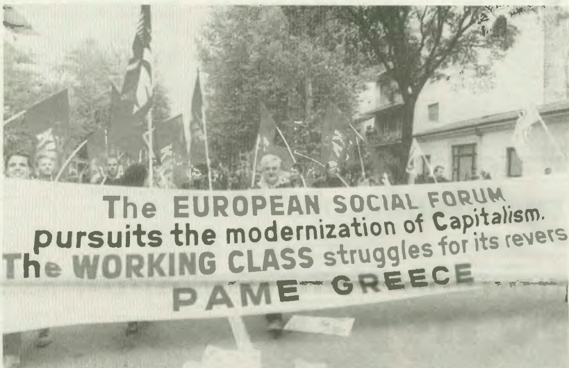
Από τη συμμετοχή του ΠΑΜΕ στις διαδηλώσεις της Φλωρεντίας

Ο ίδιος ο πρωτοπουργός έθεσε πρόκληση το έθνος απαγορεύοντας τους διαδελαικούς, προαναγγέλλοντας την ενταξη της κρατικής και εργοδοτικής τρομοκρατίας