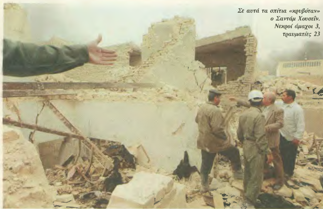
Σε αυτά τα σπίατα «καρβύδια» ο Σανάτι Χουαίτιν. Νεκροί άμαχοι 3, τραυματίες 23

νά ελληνικά πληρώματα βρίσκονται στα ΑΒΑΚΣ.