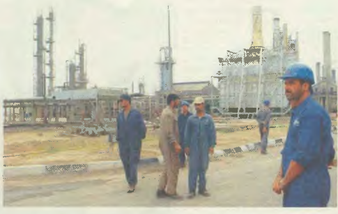
Πετρελαϊκές εγκαταστάσεις στο Ιράκ. Για τους ιμπεριαλιστές το «ψυμμί» είναι εδώ

Πασισταύρο επιτυχημένος στις πετρελαϊκές γιμνάζες είναι ο αντιπρόεδρος Ντικ Τσέιλι, ο οποίος μέχρι το 2000 ήταν διευθυντής συνθέσεων της γιγαντιαίας πετρελαϊκής και κατασκευαστικής εταιρείας HALLIBURTON, της μεγαλύτερης εταιρείας