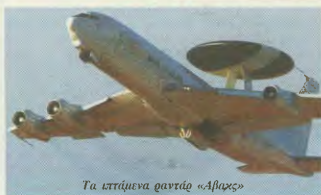
Τα ιπτάμενα ραντάρ «Αβραχ»