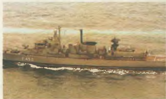
Η φρεγάτα «Ελλά»