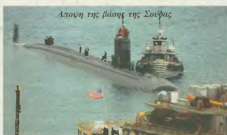
Αστυνή της βάσης της Σουδίας

Στη Σουδία από τις 20 Γε-ναρίου 2003, που άρχισε η κλιμακώση της κρίσης, μέχρι τις προηγούμενες μέρες, στη μεν αεροπορική βάση είχαν προσηγεί 1.726 με-ταγωγικά και 193 μαχητικά αεροσκάφη, αμερικανικά και βρετανικά. Στη δε ναυτική βάση της Σουδίας ελλιμενίστηκαν μέσα στο Φλεβάρη 86 «ομμαχηκά» πολεμικά πλοία, ανάμεσα τους πυρηνόκλινητα αεροπλανοφόρα και υποβρυχία, ενώ από την 11η Σεπτεμβρίου 2001 έχουν ελλιμενιστεί 616 πολεμικά πλοία, από τα οποία τα 269 αμερικανικά.