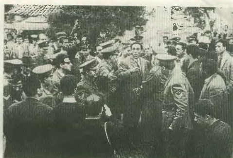
Ο Γαλλικός Λαμπερδισμός ανήκναι σε χωροφυλακές σε ένα από τα μπλόκα της διαδρομής

Ο Λαμπράκης θα συνεχίσει πότε μόνος του, πότε μαζί με μερικούς αγωνιστές που καταφέρνουν να περάσουν από τα μπλόκα της Χωροφυλακής μέχρι το Πι-