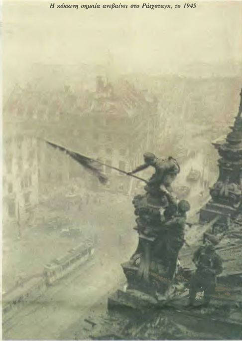
Η κόκκινη σημαία ανεβαίνει στο Ράιχσταγκ, το 1945

ναός από το τραπέζι τη στρατιωτική ρόβδο του, προχώρησε με αβέβαιο βήμα προς το τραπέζι μας. Το μονό του έπασε και κρέμαστηκε στο κορδόνι. Το πρόσωπό του γέμισε με κόκκινες κηλίδες.