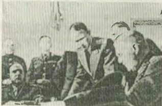
Επάνω: Ο Σοβιετικός στρατηγός Ζίνκοφ διαβάζει την Παράξη της άνευ όρων παράδοσης της Γερμανίας Κάτω: Ο Γερμανός στρατηγός Κάιτελ υπογράφει την Παράξη της παράδοσης της χώρας του

σε τη Γερμανία" (Ι. Β. Στόλνι "Ο Μεγάλος Πόλεμος για την Πατρίδα", έκδοση "ΤΑ ΝΕΑ ΒΙΒΛΙΑ", Αθήνα 1946, σελ. 136-137).