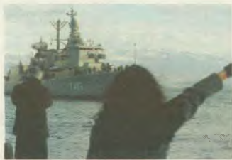
Η φρεγάτα «Κουντουριώτης»

Η Ελλάδα συμμετέχει πομπά στον ιμπεριαλιστικό πόλεμο κατά του Ιράκ και στη σφαγή του ιρακινού λαού. Η υποστήριξη που παρέχει η Ελλάδα στις αμερικανοβρετανικές δυνάμεις είναι καθοριστική. Είναι χαρακτηριστικό ότι η συνεισφορά της Ελλάδας είναι μεγαλύτερη από αυτήν της Ισπανίας, που είναι ανάμεσα στις τρεις χώρες, μαζί με τις ΗΠΑ και τη Βρετανία, οι οποίες κηρύχτην τον πόλεμο. Σε κάθε περίπτωση, δε, η ελληνική συνεισφορά είναι σημαντικότερη απ' όλες τις άλλες ΝΑΤΟικές χώρες, ακόμα και από αυτήν της Τουρκίας! Η ελληνική συμμετοχή στον πόλεμο και η υποστήριξη στις δυνάμεις που έχουν εισβάλει στο Ιράκ είναι πολύπλευρη. Έχει τη μορφή «διοικληνώσεων» στις δυνάμεις των αεροδρόμων. Ας το δούμε πιο συγκεκριμένα.