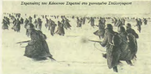
Στρατιώτες του Κόκκινου Στρατού στο χιονισμένο Στάλινγκραντ