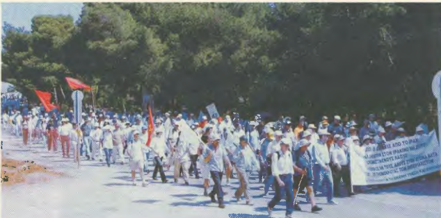
Στη γιορτή από τη Μαραθώνα Πορεία Ερήνης

Οι επικινδύνες για την ανθρωπότητα εξετάζονται δημιουργώντας επείγουσα ανάγκη οργάνωσης ενός πανευρωπαϊκού μετώπου, που πάλης σε εθνικό και σε παγκόσμιο επίπεδο, κατά της πολιτικής των ΗΠΑ, αλλά και κατά της ιμπεριαλιστικής πολιτικής της ΕΕ, του ΝΑΤΟ και άλλων οργανισμών. Ενα μέτωπο, που θα συνενώσει όλα τα κοινωνικά κινήματα και θα στοχεύει στην ανατροπή της «νέας τάξης» στην κατάσταση που χιλιάδες άνθρωποι που χιλιάδες χιλιάδες ανθρώπων με λαϊκές κυβερνή-