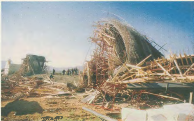
Τα κατάρυατα μιας ακόμη εργατικής τραγωδίας

καλάθι κάπου γαντζώθηκε οπίσθια, πετώντας το από ύψος 18 μέτρων στο έδαφος. Ο συνάδελφος δεν είχε καν ζώνη προστασίας. Ενώ ταυτόχρονα με την εργασία που έκανε έπεσε να χερζίζεται και το γερανό.