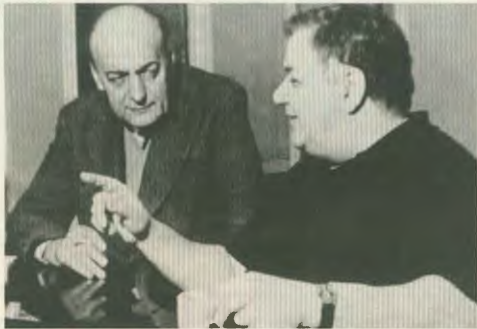
Ο Μάνος Χατζιδάκις με τον ποιητή Νίκο Γκάιτο

«...το τραγούδι μάς ενώνει μέσα 'ν έναν κοινό μύθο. Κι όπως στο χορό (έτσι και στο τραγούδι), ενώνουμε τα χέρια μεταξύ μας, για ν' ακολουθήσουμε μαζί τις ίδιες εσωτερικές δυνάμεις. Κι όσο για τον κοινό μύθο που δεν υπάρχει στις μέρες μας, τον σχηματίζουμε καινούριο κι απ' την αρχή κάθε φορά...» (Μάνος Χατζιδάκι)