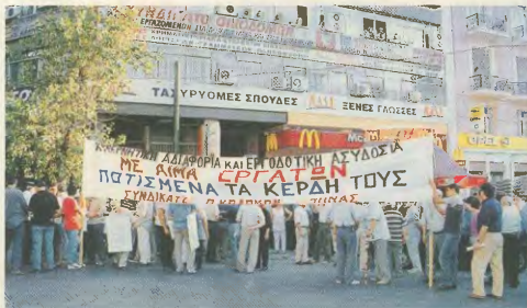
Οι οικονομία και όλοι οι άλλοι εργαζόμενοι δεν έχουν τίποτα να κερδίσουν από τις διάφορες "θελαγμομαζίες", που εξελίσσονται στο εσωτερικό των κομμάτων του δικαιοκρατίας

Δικαιολογούν και αποκάμπτουν το βαρβάρητα του ΜΑΤαμάτος κάθε λίκια κινησιποήσης. Ακόμα, καλλιεργούν κλίμα παραλυτικού πολιτικού, ενόψει του (...πνωμένου) καινούσιου στο τέλος της άλλης βδομάδας... Οι πολυδωμισιόμενες "πολιτικές πρωτοβουλίες" Σημίτη δεν είναι παρά υποδότηση διαχειρίσης εντυπωσιακού, ο "τέλειος" αποπροσανατολισμός. Η ουσία περνάει δίπλα, στη σκόνη του κομματος, με τη συντονισμένη αντιλαϊκή επίθεση. Εκεί πρέπει να είναι στραμμένη η προσοχή. Εκεί δννται και οι πραγματικές μάχες.