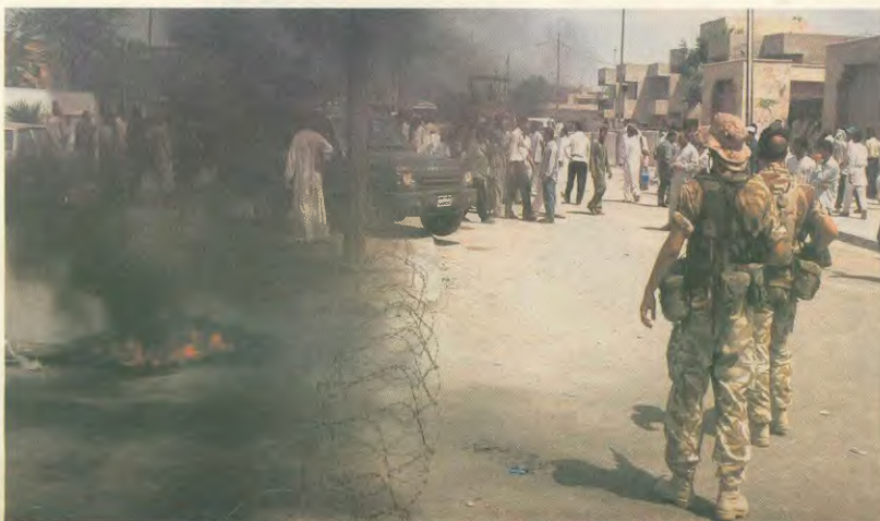
Ιρακινούς πολίτες στη Βαούρα, ενώ έχουν απέναντί τους πάνοπλους Αμερικανούς στρατιώτες

Η οργική διαφορά για την αδυναμία αντιμετώπισης του γόου έχει, πλέον, μετατραπεί σε