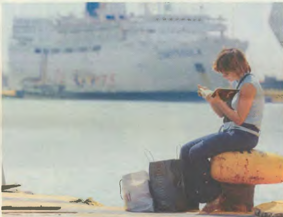
Τα πλοία μπορούν να περιμένουν καλύτερες μέρες...

Ας δούμε κατατάμη τη σκληρή πραγματικότητα που κάνει δύσκολη, αν όχι απλησίτητη, την πραγματοποίηση των "ονείρων" των καλοκαιριών δικαστών, την ικανοποίηση της σύγχρονης ανάγκης: