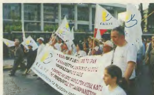
Η πορεία περνάει μπροστά από την αμερικανική προξενία

Το σύνθημα μας είναι: «Κατά τη τρομοκρατία των ιμπεριαλιστών» Ο λαός θα διαλέγουν εκμεταλλεύονται, και πολεμοκίνητους, αλλά αγωνίζονται να τους ανατρούν.