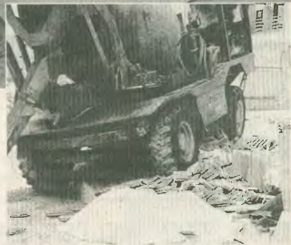
ΕΡΩΤΗΜΑ: ΠΟΙΟΣ ΤΕΛΙΚΑ ΦΥΓΑΔΕΥΣΕ, ΚΑΙ ΑΥΤΗ ΤΗ ΦΟΡΑ, ΤΟΥΣ ΟΜΟΡΡΑΠΕΣΟΥΣ ΤΟΥ Κ. ΣΗΜΗΤΗ,

Ποιος θα πληρώσει γι' αυτόν το θάνατο; Η πολιτική της κυβέρνησης και η αουδοσία των εργοδότην που συνδέονται για πάνω από 100 νεκρούς εργάτες μέσα στο 2003 θα κτίσουν στο σκαμνί. Θα δικαστούν και θα τιμωρηθούν; Η απάντηση είναι όχι. Τα αστικά δικαστήρια και οι νόμοι τους υπάρχουν, που να εξυπηρετούν το συμφέρον του κεφαλαίου και όχι να ενισχύ-