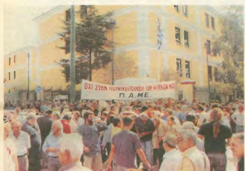
«Εξοικονόμηση» πονη πέμπτη μισθών φυλάκισης με τριημέρη αναστολή σε βάρος επτά στελεχών του ΠΑΜΕ, με αφορμή την κατάληξη του ιστορικού εργατοσυντάξεων, το 2001 (φωτογραφία βέλγη), η γκαλερί του ΠΑΣΟΚ επιχειρείται να δικαιώσει το δικαίωμα των εργαζομένων να αγωνίζονται. Ανάπτυξη, υστέρηση, υστέρηση, πηγε υμώνας από χιλιάδες εργαζομένους, που συγκεντρώθηκαν έξω από το δικαστήριο.

Ο συνδικαλιστικός αγώνας δε δικάζεται, δεν ποινικοποιείται, δε φυλάσσεται, σημαίνει η δικαιοσύνη του Σωματείου Εργαζομένων Ναυπηγικών Ελευσίων, εκφράζοντας την αντίθεση στη διαδήλωση και καταδήλωση των συνδικαλιστών.