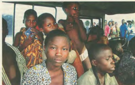
Ομάδα από τα παιδιά που απελευθερώθηκαν

«Η κατάσταση αυτή είναι παράλογη. Ο Οργανισμός Τροφίμων και Γεωργίας (FAO) λέει ότι ο πλάνης θα μπορούσε να φράξει χωρίς πρόβλημα 12 δισεκατομμύρια ανθρώπους και εξεί-