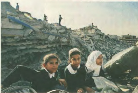
Μικρές Παλαιστινιές κάθονται πάνω στα ερείπια των καταστραμμένων τους σπιτιών

Αναμφώβολα, όπως αναφέρονται οι ίδιοι οι Ισραηλινοί επιτελείς, η διετική Ισραηλινά επισημασθεί από τη χρησιμοποίηση στην πρώτη γραμμή του πυρός, ως ήλιων, των εκκαθάρσεων. Παρ' όλα αυτά, η τακτική της καταδίκης παλαιστινιακών οπιών δεν είναι καινούριο στέαα. Όπως επισημαίνει η ισραηλινή ανθρωπιστική οργάνω-