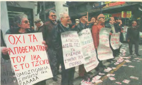
Τα συνδικάτα έχουν, ήδη, προειδοποιήσει για τις συνέπειες της πολιτικής που ακολουθεί η διοίκηση του ΙΚΑ με την καθόριση της κυβέρνησης

Την απόφαση της κυβέρνησης να φορτώσει στο ΙΚΑ άλλα ελλειμματικά Ταμεία, χωρίς να αναλαμβάνει το Δημόσιο το