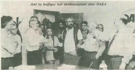
Από το διάημμα των συνδικαλιστών στον ΟΑΕΔ

Την πρωτοβουλία για την παράσταση διαμαρτυρίας πήραμε οι Ομοσπονδίες: Οικοδόμοι, Εργατοσύντακτοι Κλωστοϋφαντουργίας - Ξυλουργοί - Δερμάτινοι, Εργαζόμενοι