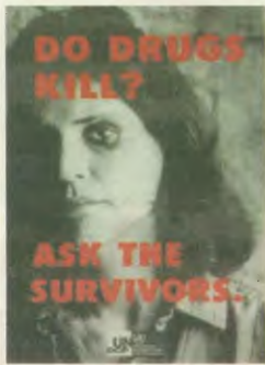
«Σταύρωση τα ναρκωτικά», είναι η φράση στην αίσια του ΟΗΕ. Και η αντίληψη: «Ρυτίστε τους ελιξίριους»

Η παράδοση του ΚΕΘΕΑ σύμφωνα με την Επιτροπή για το Βραβείο, ξεχώρισε για την υψηλή αποτελεσματικότητα της ως προς την προσωπική ανάπτυξη των παιδιών, τη βελτίωση της ψυχωσιατικής τους υγείας, αλλά και την υποστήριξη των γονιών, ώστε να ανταποκριθούν καλύτερα στις ανάγκες του ρόλου τους. Επίσης το σχολικό περιβάλλον βελτιώθηκε δραματικά, με λιγότερα επεισόδια εχθρο-