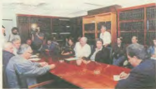
Από το διάβημα των 8 Ομοσπονδιών στη διοίκηση του ΙΚΑ

«Τα αποθεματικά του ΙΚΑ είναι λεηλάτη των εργαζομένων. Δεν θα διαπραγματευτούμαστε. Δε θα σως επιτρέψουμε να τα κοπρίσει στο χρηματιστήριο. Αντί η κυβέρνηση να μειώνει τις εργοδοτικές εισφορές, απαιτούμε να καταργηθούν οι εισφορές των εργαζομένων για τη Υγεία. Το σύνολο των δαπανών για την Υγεία να αναληφθεί από το κράτος». Τις ξεκαθάρσε αυτές θέσεις - απαιτήσεις διαλύσιμες, μεταξύ άλλων, στον δικαστή του ΙΚΑ, Μ. Νεκτάριος, η αντιπροέσβη των ογτώ ομοσπονδιών του ιδιωτικού τομέα κατά τη διάρκεια διαδηλώσεων διαμαρτυρίας.