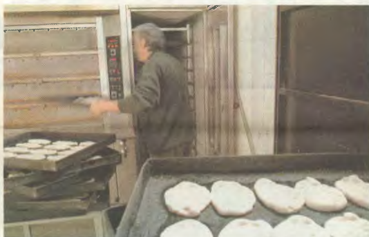
Το ψωμί ψωμάκι θα λέμε στην χωρολεξία, μετά την τροπή που έχει πάρει η κατάσταση με την ακρίβεια

Τ ο πλέον βασικό είδος διατροφής είναι από τα πρώτα που προκείται να αναμειθύνον με τη νέα χρονιά. Το ψωμί, η τιμή του οποίου θα αυξηθεί κατά 5 - 10 λεπτά τη φρατόλόδα, δίνοντας ακόμα μεγαλύτερη ώθηση στην καθημερινή ακρίβεια που αντιμετωπίζονται τα λαϊκά νοικοκυριά. Στην αύξηση αυτή προσανατολίζονται οι αρτοποιοί, όπως προκύπτει από τις δηλώσεις που εκαναν οι εκπαιδωμένοι της Ομοσπονδίας Αρτοποιιών Ελλάδας, μετά από τη συνάντηση που είχαν πρόσφατα με τον υπουργό Ανάπτυξης Κ. Κουλούρη, τον οποίο και ενημέρωσαν για τις προβέσεις τους. Οι ίδιοι υποστηρίζουν ότι ο κλάδος έχει απορροφήσει για μεγάλο διάστημα τις αναμειθύνσεις που έχουν επιβάλει στα αλευριά και αλευροβιομηχανία. Ηδη, από το καλοκαίρι το αλεύρι, σύμφωνα με τους αρτοποιοί, έχει ακριβυνεί κατά 5% - 12%, ενώ όλο αναφέρουν, προσημίζοντας και νέες μεγάλες αυξήσεις μέχρι και 20% από τον καινούριο χρόνο. Προκειται για αυξήσεις αδικαιολόγητες, τουλάχιστον με βάση τα μεροκάρια των εργατών η, πολύ περισσότερο, τις τιμές που πληρώνουν οι αλευροβιομηχανίες στους αρτοπαραγωγούς. Τιμές εξευτελιστικές, που παραμένουν καθελογιαμένες περίπου στα επίπεδα της προηγούμενης εκκοστίας! Γενιχώς που αποδεικνύεται ότι η κυβερνητική πολιτική έχει εκχωρήσει στους αλευροβιομηχανών πληρη συνδοσία να λυαίνονται το κύκλωμα ασιτήρ - αλεύρι - ψωμί σε βάρος, σε όσες περίπτωση, των ασθενέστερων κρίκων της αλυσίδας και, τελικά, του καταναλωτή. Τα αρτοποιεία, αναφέρουν οι εκπαιδωμένοι τους, δεν μπο-