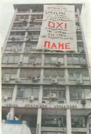
Από καλύτερη κατάληψη των γραφείων του ΙΚΑ από μέλη του ΠΑΜΕ

Τον όποιο αγώνα δίνουμε πρέπει να τον βλέπουμε από τη σκοπιά της τάξης μας. Δεν μπορεί να είμαστε όλοι ευχαριστημένοι και οι εργοδότες και οι εργοδότες. Κάποιος πρέπει να χάσει, κάποιος πρέπει να πάρει. Η ασφάλισή μας είναι το ελάχιστο που διεκδικούμε επί αυτό που μας ανήκουν. Να μη διαφεύγει από κανενός το μισλό τί είμεν δημιουργούμε και οι εργοδότες, το κεφάλαιο εκμεταλλεύεται και πλατύνει απ' αυτό. Πλατύνει από τη δουλειά