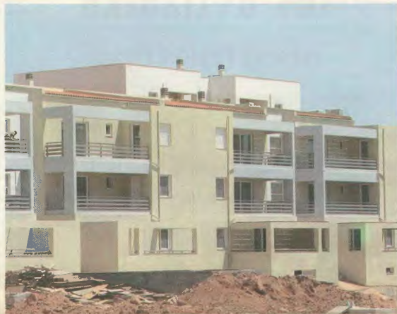
Τα σπίτια που θα κληρωθούν στο Ολυμπιακό Χωριό

Μήπως θα κληθούν οι δικαίωχοι να πληρώσουν τις κατοικίες του ΟΧ για βίλες;