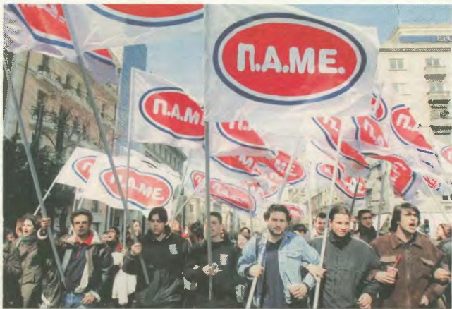
Μόνο η αποφασιστική και μαζική κινητοποίηση του λαού μπορεί να σταματήσει την καπιταλιστική λαίλαπα

Η αλλαγή αυτή πλείους είναι ευδακτική και στον κρατικό προϋπολογισμό του 2004, αν και πρέπει να θυμίσουμε ότι και στις εκλογές του 1996 και 2000 οι ποσοκλικές παροχές κινήθηκαν στα αυστράρα πλαίσια που καθόριζε το πρόγραμμα «σύνκλησης». Πιστή στον «ευρωπαϊκό προσανατολισμό» της χώρας η κυβέρνηση Σημίτη πτώσε, τώρα, ένα ξεροκαμάτω στα πινεξοβραβωμένα λαϊκά ατόμωα, αυτά που βρίσκονται κοντά το κατομήρι της απόλυτης ένδεας (ανταρτοσύνη ΟΓΑ, ΙΚΑ, ύνερο, άτομωα με ειδικές ανάγκες κλπ.) κι αυτό είναι όλο. Ο εμπαιγμός και η πώκηση συνίσταται στο γεγονός ότι οι στόχοι των παρελθόντων, Ευρωπώ Κομμήτης της Λεσβάνος, είνε απροσφαιστική η πλήρης καταδράση των εργατικών κατακτήσεων μέχρι το 2010, στο όμωα της αύξησης της ανταγωνιστικότητας του ευρωπαϊκού κεφαλαίου,