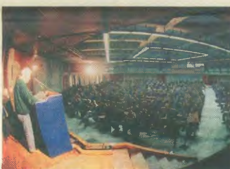
Από το 19ο Συνέδριο της Ομοσπονδίας μας

Το συνέδριό μας καλείται να στρέψει την πάλη του κλάδου, κόντρα στις καπιταλιστικές αναδιαρθρώσεις, για νέα δικαιώματα.