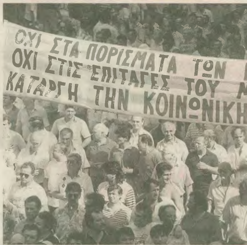
που τους παρέχει το κράτος του κεφαλαίου, αποδοσία που τους οδηγεί να θεωρούν τους εργαζόμενους ανάλωστα υλικά.

Οι όποιες αναπληρωτικές συντάξεις, πρώτα και κύρια έχουν να κάνουν με τις άθλιες συνθήκες εργασίας, την εντατικοποίηση, τα ανθυμικά μέτρα προστασίας, Οι ακροτηριασμοί, οι πιέσεις από ύλως, οι νηρομολογίες παθήσεις, οι δικαιοδικές, η μείωση της φρεσής και μια σειρά άλλες αναπληρωτικές έχουν να κάνουν με την αποσπασία των εργαζομένων, αποδοσία