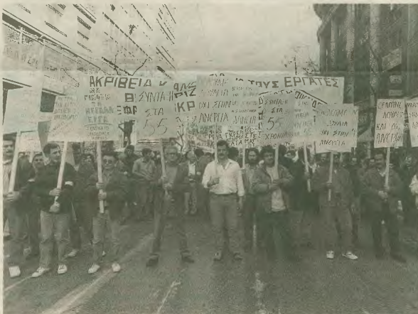
Αυτοί που υπέγραψαν για την κατάργηση κατακτήσεων και δικαιωμάτων μας, γρήγορα θα έρθουν αντιμέτωποι με την οργή των εργαζομένων

νοντας το σχετικό κείμενο ότι με αυτό το πύλο οριστικό δυνάμειο στην ΓΣΕΕ δεν μπορούν οι εργαζόμενοι να περιμένουν τίποτα, αλλά κινδυνεύουν να χάσουν και αυτά που με πολυχρόνιους αγώνες κερδίσαν.