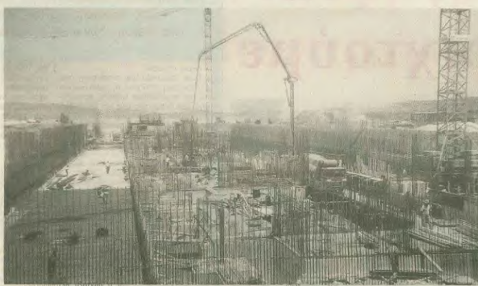
Η περιφρούρηση της ασφάλισής μας και η διεύθυνση των δικαιωμάτων μας είναι ζήτημα ζωής για τους οικοδομείς (η φωτογραφία από τον εργοτάξιο στο νέο αεροδρόμιο Σπάρτης)

Σύνταξη στα 58 χρόνια μπορεί να πάρει οποιοσδήποτε εργαζόμενος, αφού έχει συμπληρώσει 35ετία και 10.500 ένσημα στην υπαγωγή στο ΙΚΑ, ανεξάρτητα αν είναι οικοδομικά, βαρέα ή μετράκι κ.λπ. Σ' αυτή την περίπτωση προσημειώνω για τη συμπλήρωση των 10.500 ο χρόνος σφράγισης και ο