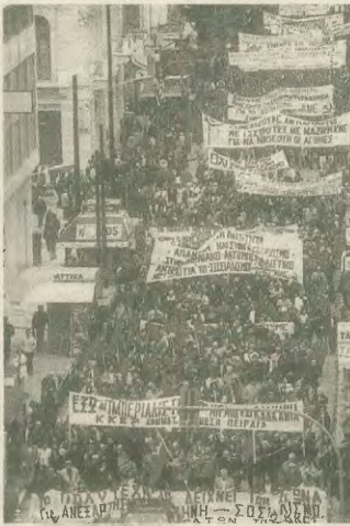
Μηνύματα αντίστασης, άνησης στην υποταγή και στο συμβιβασμό εξακολουθεί να στέλνει η εξέγερση του Πολυτεχνείου

Ποιο όμως είναι ανεπιτήρητο από τα συνθήματα του Πολυτεχνείου; Έτσι τους θέλει να λένε. Ποιος αμνησθεί ότι η ΗΠΑ - ΝΑΤΟ πάντα τα είναι ο ίδιος μηχανισμός της τρομοκρατίας, της θιάς και της υποδούλωσης των λαών και για αυτό ο ελληνικός λαός και σήμερα απαιτεί την διάλυση της Λυκοστρατομαχίας, ποιος σκεπτατόμος πολιτής σήμερα αμνησθεί ότι η χώρα μας βρίσκεται σε καθυστερημένο εξάρτησης, τυπικά και ουσιαστικά πλέον είναι