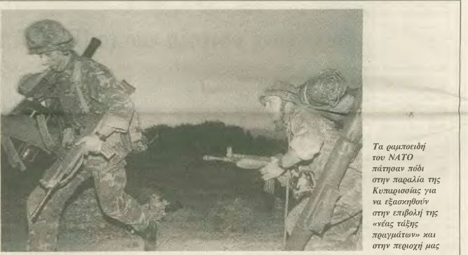
Τα αεροπλάνα του ΝΑΤΟ πύρρασαν πλοίο στην παραλία της Κωσταρικής για να εξασφαλιστούν στην επικήλυση της «αγίας γαλάς» των πλοίων και στην περιοχή μας

Η αλήθεια είναι ότι η πολιτική της κυβέρνησης κινείται στον οπικό χώρο των δικαιωμάτων, τις οποίες στην ουσία υπονομιέει, επειδή σφίγγει έτσι ονομασίες και ΗΠΑ την επίλυση του συνικού σκεδών των εξωτερικών προβλημάτων. Απόρροια αυτής της πολιτικής είναι το μεταπολεμικό σκεδών το Αιγαίο σε «βέλτα» που υπομνήσθη, με εμφανή την επίλυση των ΗΠΑ να εγκοδάρουν καθεστώς συνυποταχής, σφίγγει για να εξημερωθούν το δικό τους συμφέρον στην περιοχή, που