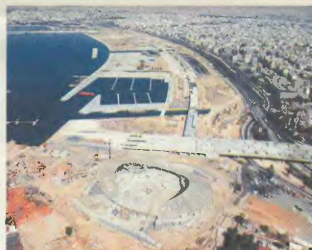
Οι Ολυμπιακές εγκαταστάσεις στο Φαληρικό Όρη

Δεν έχουμε βέβαια, αν τελικά οι εργολάβοι δε δικηδύτην να συγκεκριμένα πριν, άσφιστο το κόστος των συγκεκριμένων έργων ανεμνύεται να τρεφθεί κι άλλο την...ανήφορο, είτε με ποσοστό «επίσημο», που θα δαθούν, είτε λόγω πρόσδετων εργολάβων που θα γίνουν για έργα απαράτητα. Χαρακτηριστικό παράδειγμα αποτελείται τα έργα προαίονου και διαφόρων περι-