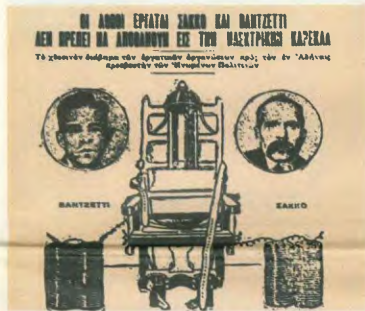
Δημοσίευμα ελληνικής εφημερίδας για τους Σάκο και Βαντζέτι