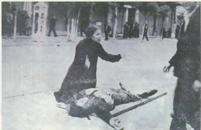
«Μέγα Μαζούι μου μισέφες...» λέει μας στην οδό Εργατιά, κατά τις 11, είναι μεγάλα γεγονότα και ακάθωκεν και τραυματίσθηκαν πολλοί... Οι χεροφυλάκες χτυπήσαν στο φωνάρι...

Οι κωπίσσες όλο των εκκλήζον χτυπήσει, της Αγίας Παρασκευής, της Νεαπόλης, όλης της Θεσσαλονίκης, όλης Αμπερτιά και άλλων πόλεων.