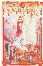
Αντιμαζική αφίσσα για την 1η Μάη 1891

Νοσφίβης 1887: Οι συνδικαλιστές Σπιάς, Φίσερ, Πίρσον, Εργέλ οδηγούνται στο θάνατο