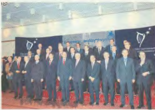
Οι ηγέτες των χωρών - μελών της ΕΕ στη συνάντησή τους στις Βρυξέλλες

Τ η βουλή τους να προχωρήσουν με ταχύτερους ρυθμούς η νεοφιλελεύθερη επίθεση μέσα από την υλοποίηση των αποφάσεων της Λισαβόνας, επιβεβαιώνεται, όπως αναμένονταν, από τις ΕΕ στις Βρυξέλλες. Παράλληλα με το «αντιτρομοκρατικό πακέτο» της Λισαβόνας, που πλήρητα κέρδιζε κάποια εγχώρια δικαιώματα και κατακτήσεις.