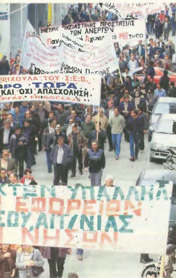
Οι εργαζόμενοι, και μετά την εκλογή της κυβέρνησης της Νέας Δημοκρατίας, θα έχουν να αντιπαραθέτουν την ίδια αντίληψη και φιλοσοφία πολιτική, που αντιμετώπισαν με τις προηγούμενες κυβερνήσεις του ΠΑΣΟΚ