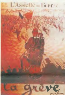
Γαλλική αφίσα για την Πρωτομαγιά