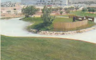
Το Γλυκό Κέντρο στο Μαρούσι, από 83,2 εκατ. ευρώ έφθασε στα 106 εκατ. ευρώ