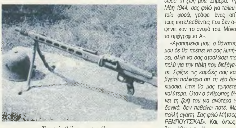
Το καλοβήλο της εκτέλεσης

Ο δρόμος προς το Σκοπευτήριό γέμισε ρούχα και σημα-νέματα. Ηταν η απελευκμένη προπόδεια για στενά-αντίο-τα μελοδονιστές, στον άναυ. Για η ζωή κατακτάται και ζωή στήριξε η ευλαβία. Και το προσκήλιο τελείω-σε. Συμληρώθηκαν οι 200 που «χρωστούσαν», για να πληρω-θεί το «γραμμάτιο» του στρατιώ-τη. Σπλήρωσε η δεύτερη της