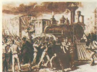
Σικάγο: Το εργατικό κίνημα θρηγεί τα πρώτα θέματα

παράλληλα κάθε αυταπόλες εργατικό κίνημα, όσον καιρό η δουλειά παραμένει ένα μέρος της δημοκρατίας. Η εργασία των ανθρώπων με λειψή επιδερμίδα δεν μπορεί να χειραγωγείται εκεί όπου στυγνάζεται η εργασία των ανθρώπων με μαυρή επιδερμίδα. Από το θάνατο της δουλειάς όμως, ξεπήδησε αμέσως μια καινούρια ζωντανή ζωή. Ο πρώτος κορμός του εμφυλίου πολέμου ήταν η ζήτηση για το οχτώωρο, που με ταμπέτα στυμμένης προχώραί από τον Ατλαντικό κόλπο της Ερηνιάς Οκτωβ. από τη Νέα Αγγλία έως την Καλιφόρνια.