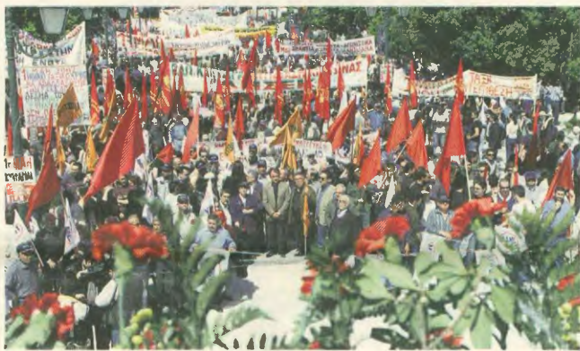
Η άφιξη των ΠΑΜΕ το 1999 άφησε ανεξίτηλα σημάδια στη μετέπειτα πορεία του ταξικού συνδικαλιστικού κινήματος

1923: Γίνονται δυο πρωτομαγιάτικες συγκέντρωσεις. Μια στο Ρέντη από το λέγόμενο «ανεξάρτητο» κέντρο Αθηνών - Περαιά και μία στο Μοσχάτο από τη ΓΣΕΕ, στη διοίκηση της οποίας είχαν εκλεγεί συνδικαλιστές στελέχη του ΣΕΚΕ. Αυτή η δεύτερη συγκέντρωση τερματίζεται κατά της υπερπολιτισμικής επέμβασης στη Σοβιετική Ένωση.