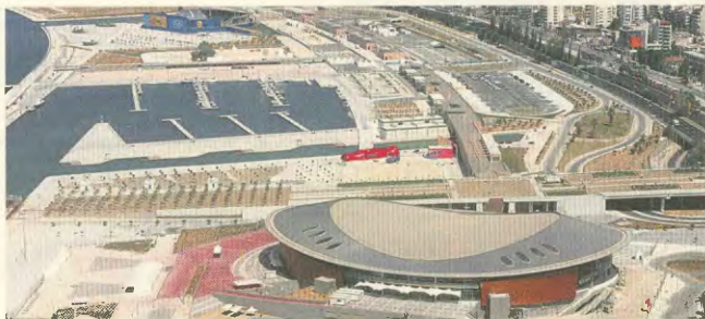
Οι Ολυμπιακές εγκαταστάσεις στην περιοχή του Φαλήρου και του Ιπποδρόμου ανήκουν σε αυτές που πρόκειται να παραδοθούν στο ιδιωτικό κεφάλαιο

Όπως σημείωσαν ο υπουργός ΠΕΧΩΔΕ Γ. Σουφλιάς και η αναπληρωτής υπουργός Πολιτισμού Φ. Πετράλη, η κυβέρνηση πρόκειται πάνω στις νομοθετικές ρυθμίσεις για Ολυμπιακές εγκαταστάσεις που είχε ψηφίσει η προηγούμενη κυβέρνηση, έρχεται ένα νομοσχέδιο με το οποίο ουσιαστικά «φυγοαγορεύονται» όλα τα αμύτημα