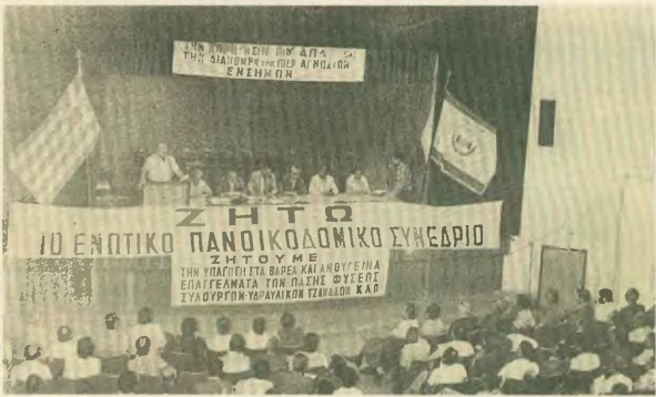
Στηγμάσιο από το 9ο Συνέδριο της Ομοσπονδίας, το 1976, όπου οι οικοδόμοι γκρέμισαν τους εργατοπατέρες

ομακίδια. Αντέπειτα πλούσια δράση και στην περίοδο εκείνη με τους συσχετισμούς δύναμης που υπήρχαν τότε στην Ελλάδα, όοι και παγκόσμια, κτηρόφωρα να αποσοποιήσουν κατακτητικές κυρίως στην Κοινωνική Ασφάλιση, να εφαρμόσει «ντε φάκτο» το 7ωρο κλπ.