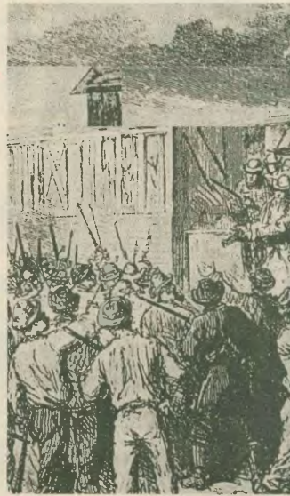
Σικάγο 1886: Το