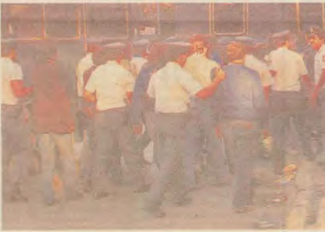
«Επιχείρηση - αρετή» με στόχο λαμβάνοντας στην Οάβουα. Όσοι συλλυμβάνονται οδηγούνται στα σύνορα και απελευθύνονται από τη χώρα

Στην Ελλάδα του 2000, λοιπόν, κοικυλοφοροί εισθάλλουν σε καταλήματα Αλβάνων και τους ε-υλολοκωμο ανίρσι. Οι μερπότερ των κανονικών, πριν ακόμα φθά-σουν στο κρεβάτι, εγκληματίες, έχουν εθάλει το πορισμα για την