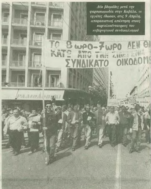
Δίο βουλόδες μετά την φασοκωνομία στην Καβάλα, οι εργατίες έθωσαν, στις 9 Απριλί, αποκαταστήτη απάντηση στους καχελοκόνατους του κυβερνητικού συνδικαλισμού

Όλο κατ' αυτούς καλά έγιναν, ο διάλογος της σπατής διασώτς ήταν, άλλοι κατ' αυτό συμμετείχαν, η ένταξη της