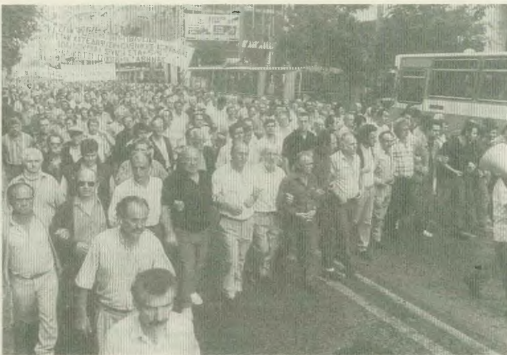
Η οργάνωση και η πάλη των εργαζομένων είναι η μόνη που μπορεί να αποτρέψει τη σωαρωτική λαίλαπα της κυβέρνησης, που θέλει να μας επαναρθέσει σε εργασιακά μισαλάνα

Θέσεις από το λαό ζήτησαν, για να μωμώμε στην Ευρωπαϊκή Ένωση, για να αντιμετωπίσουμε την ενείνα εσωτερική αγορά, για να πιάσουμε τους στόχους, να πιάσει και να μωμώμε στην Οικονομική Νομισματική Ένωση. Πάντα όμως το αποτέλεσμα είναι να θυσώνουν πρώτα και κύρια, οι εργαζόμενοι να γίνουν φτωχότεροι και οι πλούσιοι πλουσιότεροι, ο