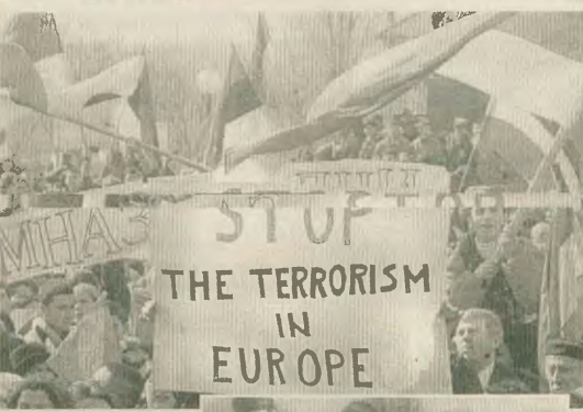
«Σταματήστε την τρομοκρατία στην Ευρώπη» γράφει το πανό των Σέρβων απαντώντας (πάνω), που διαβλάθουν ενάντια στις αμερικανικές επεμβάσεις στη χώρα τους. Αξίζει, τα μεγαλύτερα θύματα της αμερικανικής τακτικής, τα παιδιά ανεργητών εθνότητων

Είναι οίκορα, βέβαια, ότι οι αλβανών του Κοσσυφο πρέπει να ο πολικομύονται όλο τα ανθρώπινα δικαιώματα. Τέτοι προβλήματα όμως που οντιστημύονται σερβόν όσος οι χυός του κώρομ, λίνοντα στο πλαίσιο των εργατικών κομμάτων και ούνορών και έχη αποδείξει ότι είναι ούνορών να διεκδικηθούν από τους ιδιο-