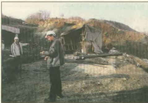
Αριστερά, η παράγκα στη σφαγή Καρατζά στα Γρεβενά χρησιμοποιείται για εστιατόριο και για να αλλάζουν οι εργάτες. Δεξιά, οι στανιάδες στο υπαίθριο εστιατόριο στην περιοχή Βελανιδιά Γρεβενών