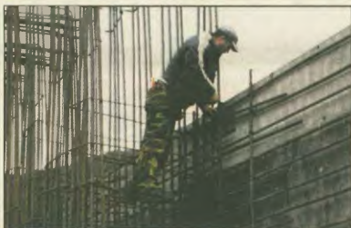
Προκύπτε, λοιπόν, το ζήτημα, τι έργα γίνονται, για ποιόν γίνονται, ποιες ανάγκες υπηρετούν, ποιες τα πληρώνει.

Στην Αττική Οδό, το ΙΧ πληρώνει 2,70 ευρώ, ανάλογα θα είναι και στην Εγνατία στην Ιόνα Οδό και σε όλα τα συγχρηματοδοτούμενα έργα που γίνονται.