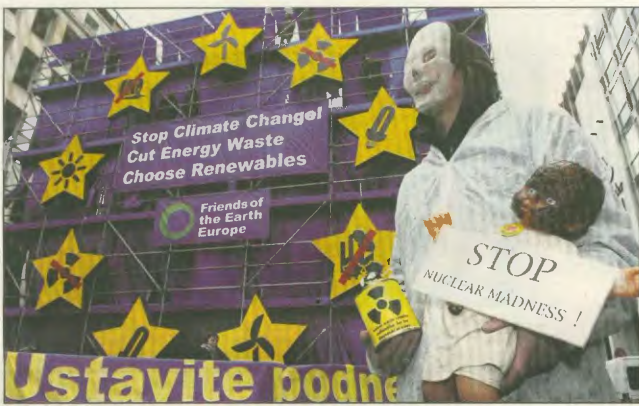
Διαδήλωση στις Βρυξέλλες κατά των αποφάσεων των «27» για την ενέργεια

Ενίσχυση των ελαστικών εργασιακών σχέσεων, ανατροπή των συνταξιοδοτικών συστημάτων, άμεση υποταγή των Πανεπιστημίων και της έρευνας στις επιχειρήσεις και παραπέρα ιδιωτικοποίηση του τομέα της ενέργειας