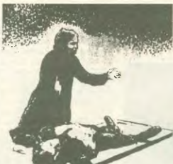
Ο ΗΡΩΙΚΟΣ ΜΑΗΣ ΤΗΣ ΘΕΣΣΑΛΟΝΙΚΗΣ ΤΟΥ '36

Η πρωτομαγιάτική, όμως, απεργία του 1888 δεν πήγε χαμένη. Είχε ως αποτέλεσμα 185.000 εργάτες να κερδίσουν το βωρο και τουλάχιστον 200.000 εργάτες να μειώσουν το χρόνο εργασίας τους από τις 12 στις 10 και 9 ώρες. Σε πολλές, επίσης, περιοχές κερδήθηκε η πρωτομαγιά του Σαββάτου, ενώ αρκετές βοηθητικές σταθμάσαν την κυριακάτικη εργασία. Ήταν, επομένως, κάτι παραπάνω από φυσιολογική εξέλιξη, να ανακηρυχτεί η Πρωτομαγιά η Παγκόσμια Μέρα της εργατικής τάξης.