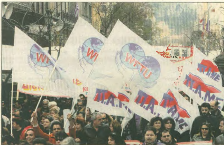
Για το ταξικό κίνημα ο συσχετισμός δυνάμεων δεν καταγράφεται και δεν περιορίζεται στις θέσεις στη ΓΣΕΕ