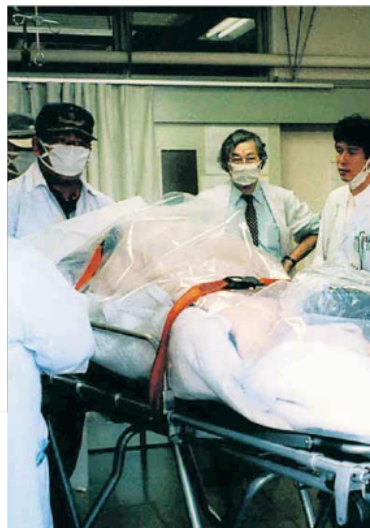
Γάιτνας εργάτης που εκτέθηκε σε ραδιενέργεια μεταφέρεται

Η αναπαραγωγή υπηρεσιών Υγείας και Ασφάλειας της εργασίας ενταγμένων οργανικά σε ένα Ενιαίο Δημόσιο Σύστημα Υγείας, σε πρωτοβάθμιο, δευτεροβάθμιο και τριτοβάθμιο επίπεδο οργάνωσης, οδηγεί αναγκαστικά σε ακύρωση κάθε προσπάθεια πρόληψης της επαγγελματικής νοσηρότητας, καθώς και στο ξεπούλημα της υγείας των εργαζομένων στο εμπορικό κεφάλαιο (Εξωτερικές Υπηρεσίες Προστασίας και Πρόληψης).