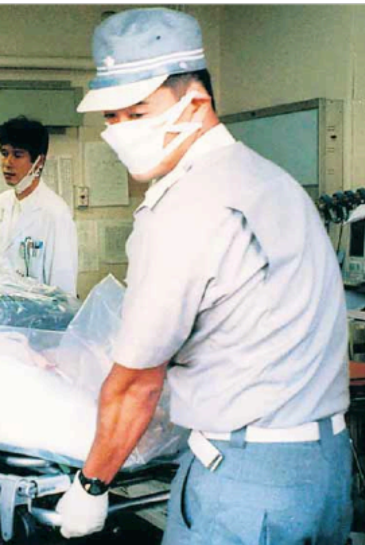
ΟΑ - ΟΙ ΑΔΕΥΟΙ, ΟΑ ΑΔΕΥΟΙ, ΟΕΘ ΤΟΔΟΥ, ΟΥΟ ΠΤΙΕΘ