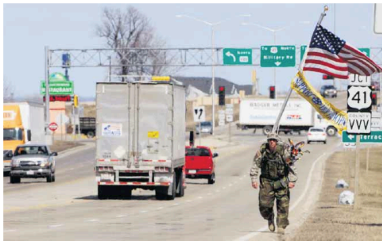
Αμερικανός ντυμένος με στολή του στρατού διασχίζει το έδαφος των ΗΠΑ με τα πόδια, αμειρώνοντας κάθε μίλι σε καθένα νεκρό Αμερικανό στρατιώτη στο Ιράκ. Ηδη έχει βαδίσει επί 2.122 μίλια και συνεχίζει...

Δεν είναι τυχαίο ότι κατά τις αντιπολεμικές διαδηλώσεις που έγιναν μέσα στη βδομάδα στις ΗΠΑ, για τα πέντε χρόνια του πολέμου στο Ιράκ, εκτός από τα στρατολογικά γραφεία σε διάφορες πόλεις της αμερικανικής επικράτειας, στην