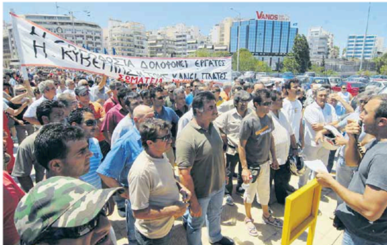
Διαδήλωση στη Ναυπηγοεπισκευαστική Ζώνη μετά από εργατικό ατύχημα

Οι πολιτικοί εκπρόσωποι του κεφαλαίου, προσπαθούν να πείσουν τους εργαζομένους ότι η κατάσταση που επικρατεί στους χώρους δουλειάς είναι το μοιραίο αποτέλεσμα, το αναγκαίο τίμημα της πρόοδου της τεχνολογίας και της βιομηχανικής ανάπτυξης. Πρόκειται για συνειδητή διαστρέφηση της αλήθειας, που στόχο έχει να αποπροσανατολίσει και να μετριάσει τις αντιδράσεις των εργαζομένων.