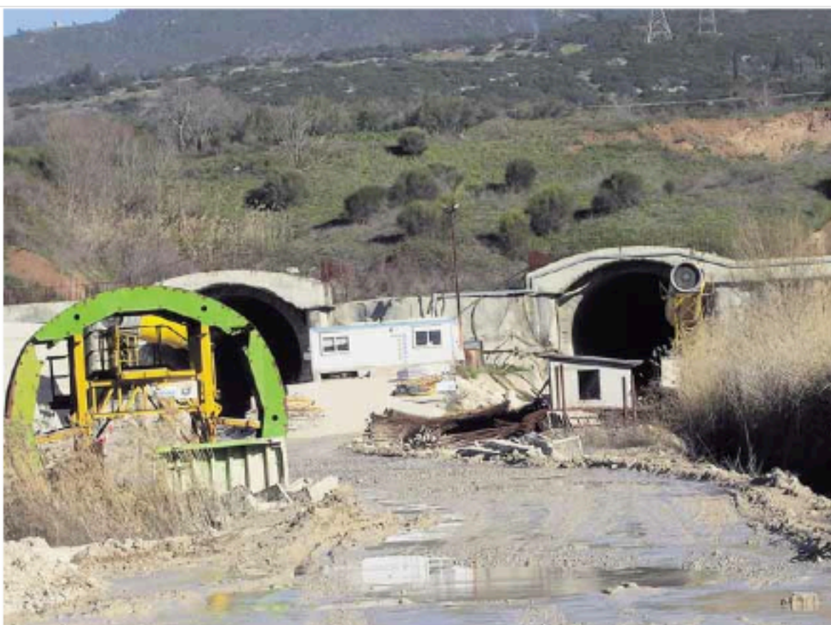
Μια από τις σήραγγες στην περιοχή Τιθορέας - Καλλιδρόμου, στο πέταλο του Μαλιακού

Για το ταξικό συνδικαλιστικό κίνημα τα έργα αυτά τα πληρώνει ο λαός εξολοκλήρου από τη τσέπη του και στο στάδιο της κατασκευής, αλλά και κατά τη διάρκεια της χρήσης τους. Το αεροδρόμιο της Αθήνας, η Αττική Οδός, η γέφυρα Ρίου - Αντιρρίου, είναι από τα παραδείγματα που τα έργα πληρώθηκαν από τον ελληνικό λαό για την κατασκευή τους και επιπλέον πληρώνουμε τα δυσβάστακτα δόδια για λογαριασμό των μεγάλων κατασκευαστών, με τις λεόντειες, μακροχρόνιες συμβάσεις που υπέγραψαν οι κυβερνήσεις ΠΑΣΟΚ και ΝΔ.