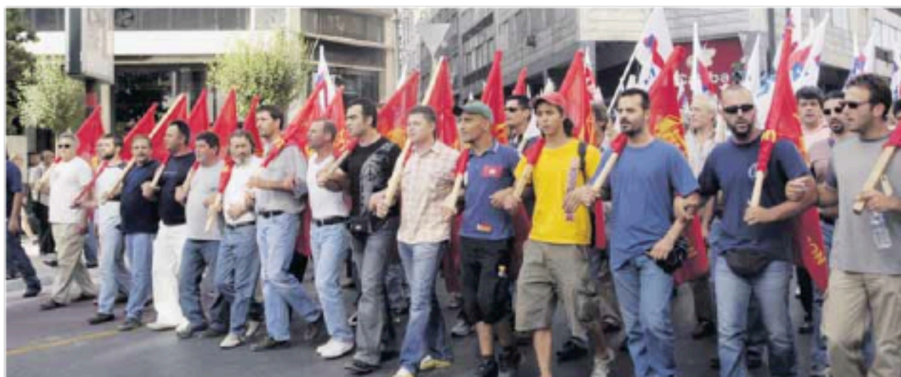
ΕΛΛΗΝΕΣ ΚΑΙ ΜΕΤΑΝΑΣΤΕΣ ΕΡΓΑΤΕΣ

Αυτή η επίδειξη «υπευθυνότητας» της κυβέρνησης αφορά όμως μόνο στην άρχουσα τάξη. Απέναντι σε αυτού του είδους την ευθύνη που αναλαμβάνει η κυβέρνηση, για εμάς τους εργαζομένους προκύπτουν οι δικές μας ευθύνες. Και η ευθύνη πριν απ' όλα σήμερα είναι με κάθε τρόπο, με κάθε μέσο, να σταματήσουμε την αντιστασιακή επίθεση, να οργανώσουμε την πάλη μας, να υπερασπίσουμε τα δικαιώματά μας. Γιατί έχουμε ευθύνη και υποχρέωση και απέναντι στον εαυτό μας, αλλά και απέναντι στη νέα γενιά.