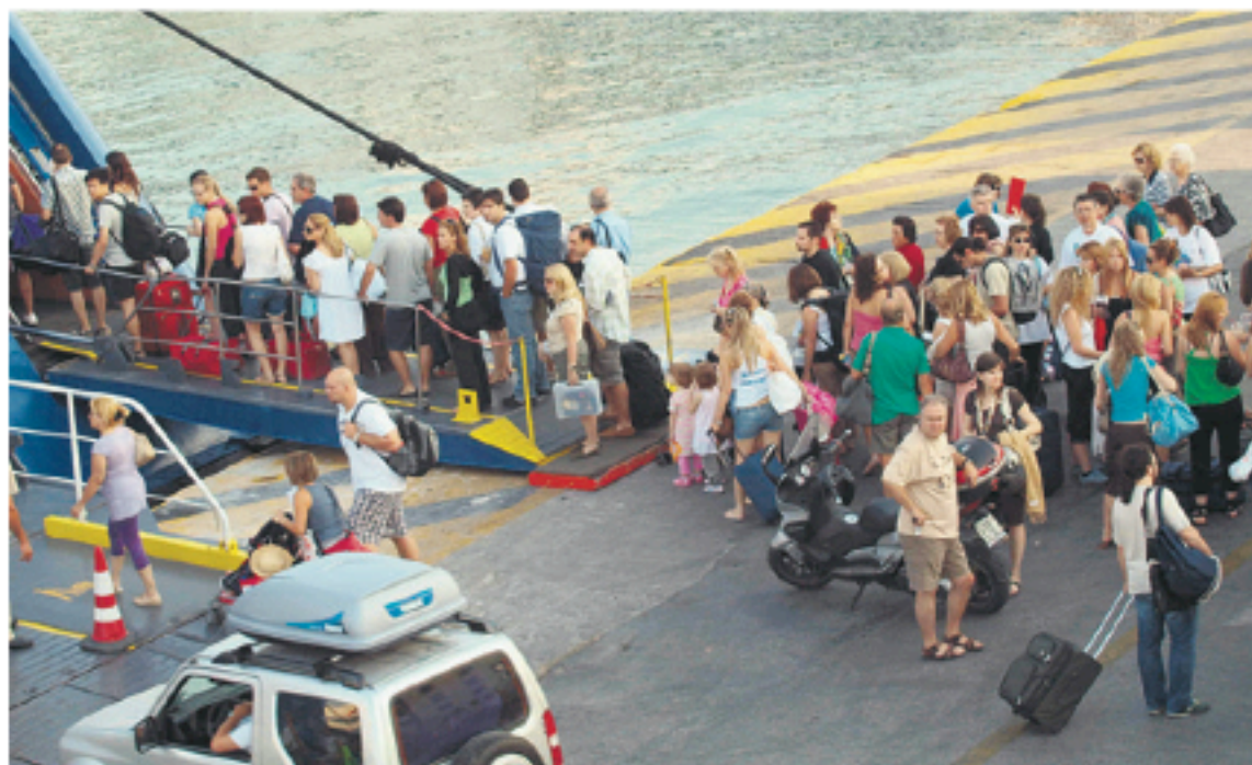
Ο εργαζόμενος πρέπει να το σκεφτεί καλά πριν πατήσει το πόδι του στο λιμάνι με προορισμό κάποιο νησί

Μια τετραμελής οικογένεια θέλει 268 ευρώ να πάει και να 'ρθει στην Ασυτάλεια, αν ταξιδέψει στην οικονομική θέση και χωρίς αυτοκίνητο. Η μετακίνηση και η διαμονή σε κάποιον τουριστικό