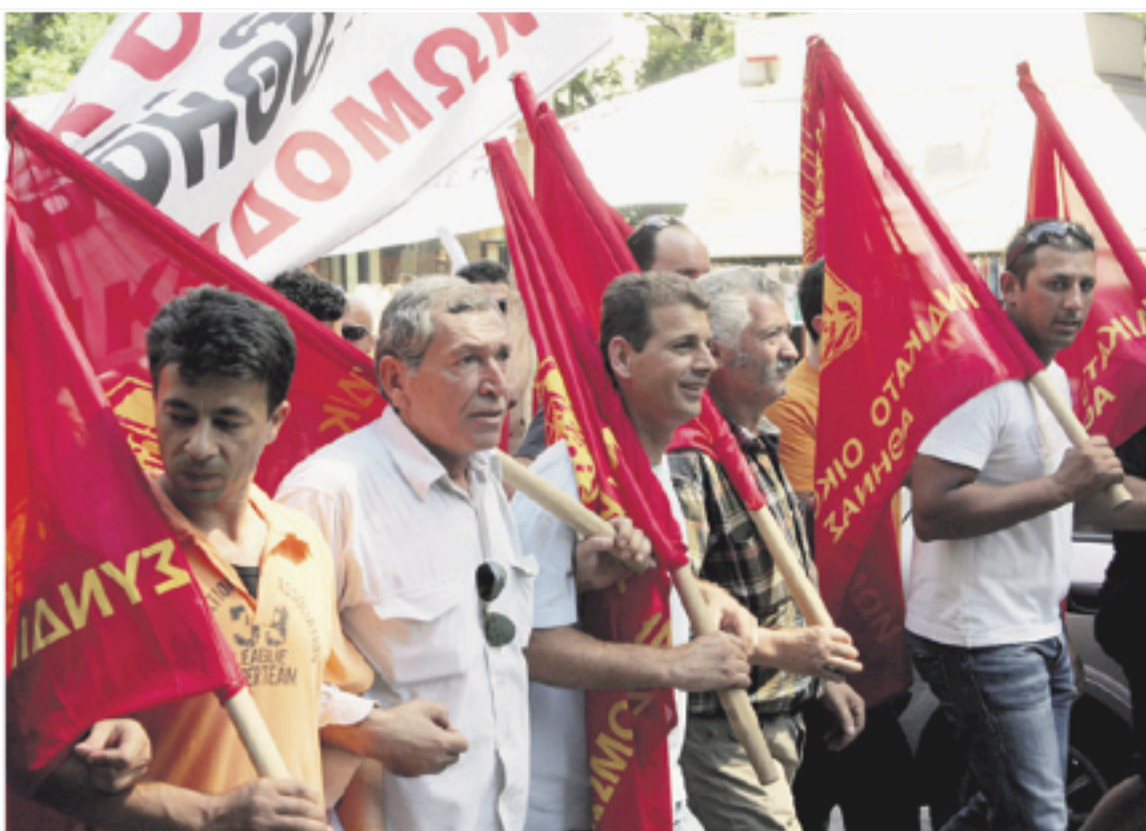
ΑΠΟΦΑΣΕΙΣ ΠΡΩΤΟΔΙΚΕΙΟΥ ΑΘΗΝΩΝ ΓΙΑ ΑΠΕΡΓΙΕΣ

Από τις 248 προσφυγές που τελικά έφτασαν στην ακροαματική διαδικασία, οι 215 κρίθηκαν παράνομες ή/και καταχρηστικές (ποσοστό 86,7%! Νόμιμες κρίθηκαν άλλες 30, ενώ τρεις ακόμα προσφυγές παρα-