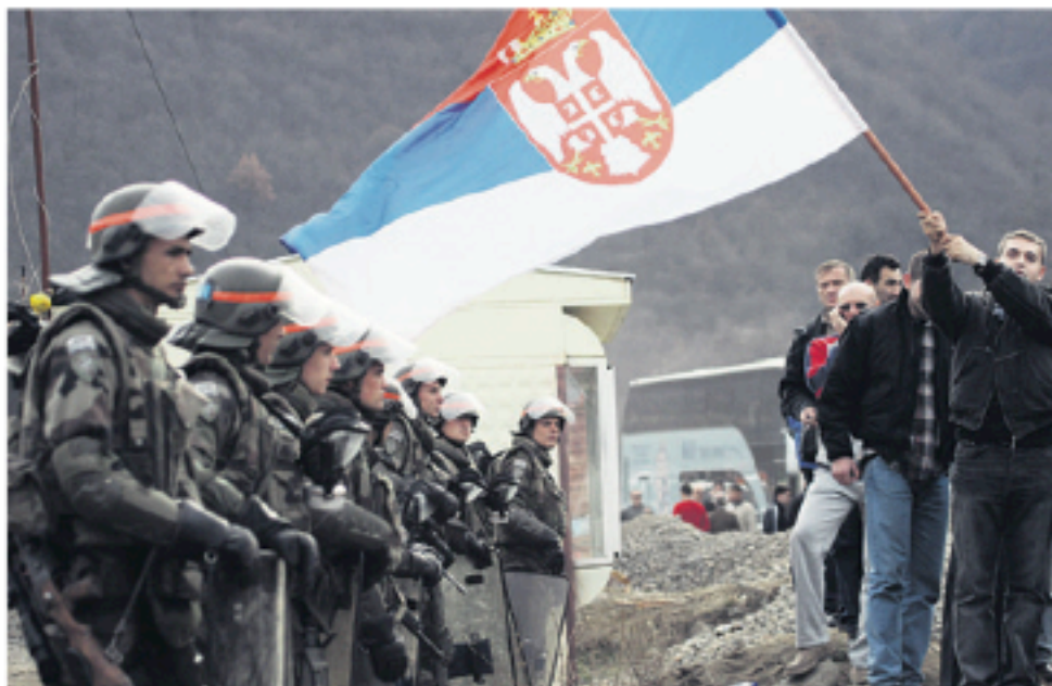
Σέρβοι διαμαρτύρονται για την κατάληψη του Κοσόβου από τους υπαλλήλους των Αμερικανών. Ούτε γι' αυτό το θέμα είχαν κάτι να πουν οι απολογητές του συστήματος

Στις 1 - 3 Νοέμβρη του 2006 στη Βιέννη, η ICFTU συνενώθηκε με μια περιθωριοποιημένη διεθνή συνδικαλιστική οργάνωση με σοσιαλδημοκρατικές απόψεις, την Παγκόσμια Συνομοσπονδία Εργασίας (World Confederation of Labour - WCL) και δημιούργησαν την ITUC. Η «νέα» οργάνωση αποτελεί μηχανισμό και συνεργάτη του καπιταλιστικού συστήμα-