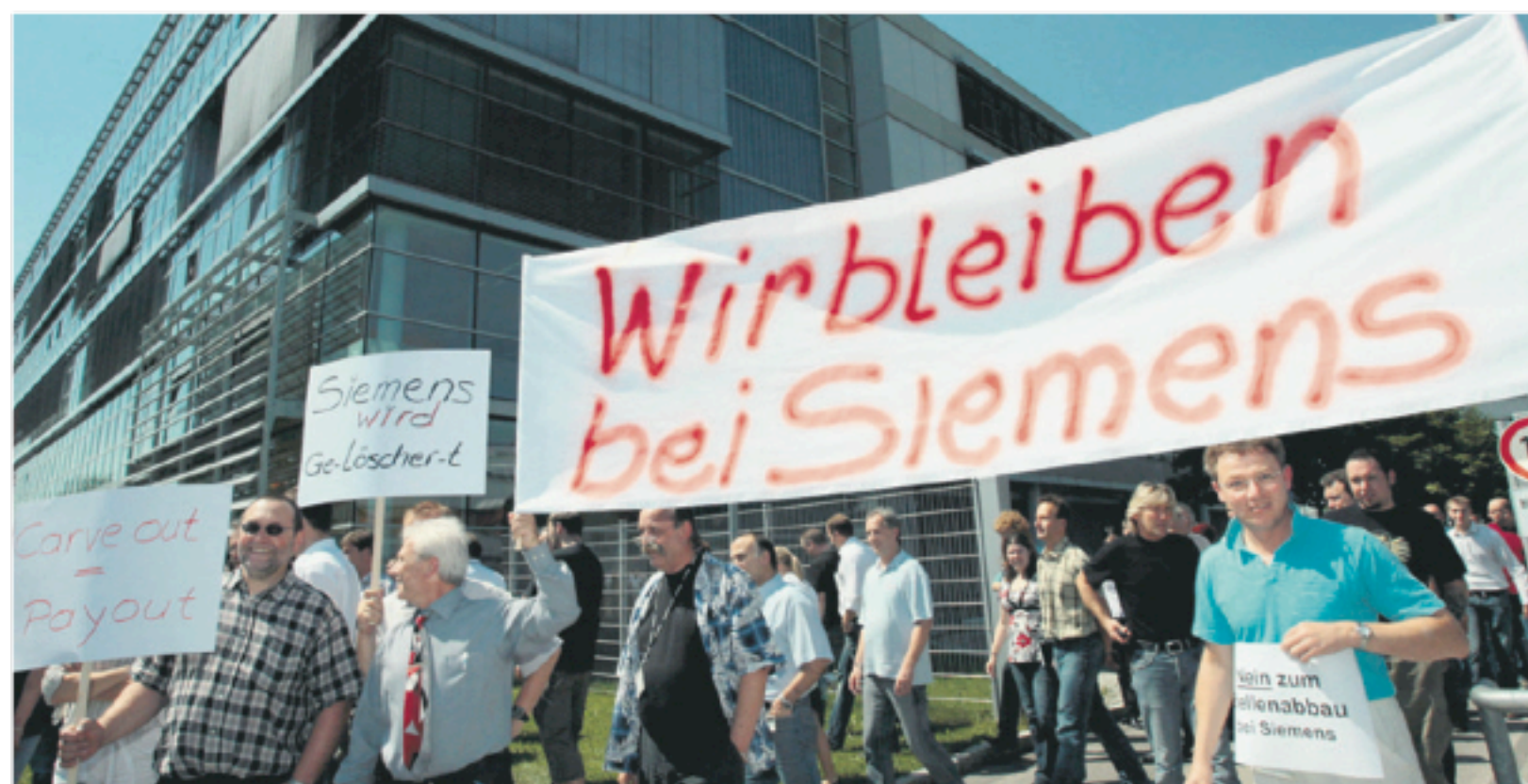
Εργαζόμενοι της μητρικής εταιρείας της «Siemens» στο Μόναχο διαμαρτύρονται για τις μαζικές απολύσεις εργαζομένων στις οποίες προχωρεί ο όμιλος