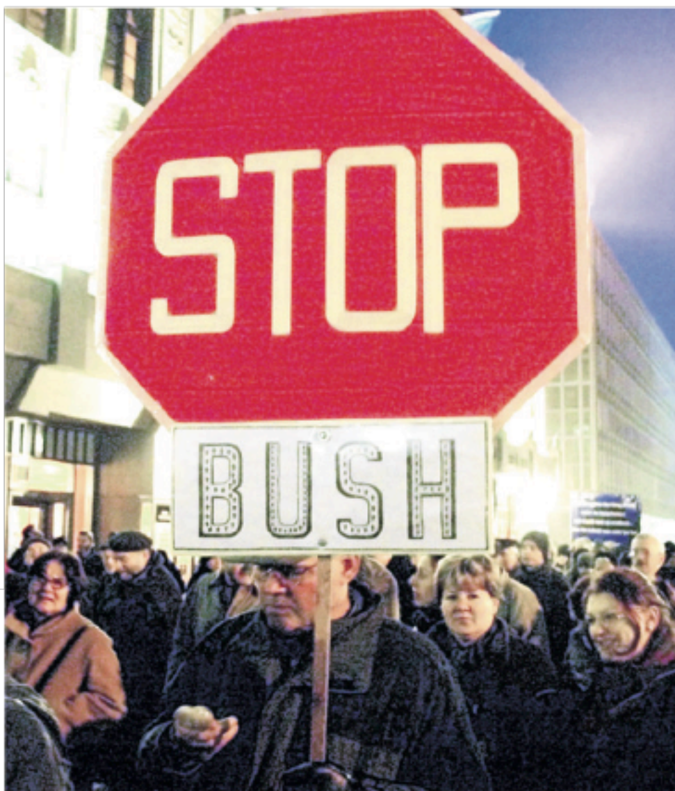
Διαδηλώσεις και κινητοποιήσεις με συνθήματα «Σταματήστε τον Μπους και την ιμπεριαλιστική τάξη πραγμάτων» δεν αφορούν βέβαια τους συνδικαλιστές-συνεργάτες του καπιταλιστικού συστήματος

Από τις αρχές της δεκαετίας του '90, οι ηγετικές δυνάμεις της νέας ιμπεριαλιστικής τάξης πραγμάτων είχαν συνειδητά ιεραρχήσει ως πρωτεύον ζήτημα για τις στρατηγικές επιδιώξεις τους τη διάλυση, τον ευνουχισμό και την αghμαλώση του ερ-