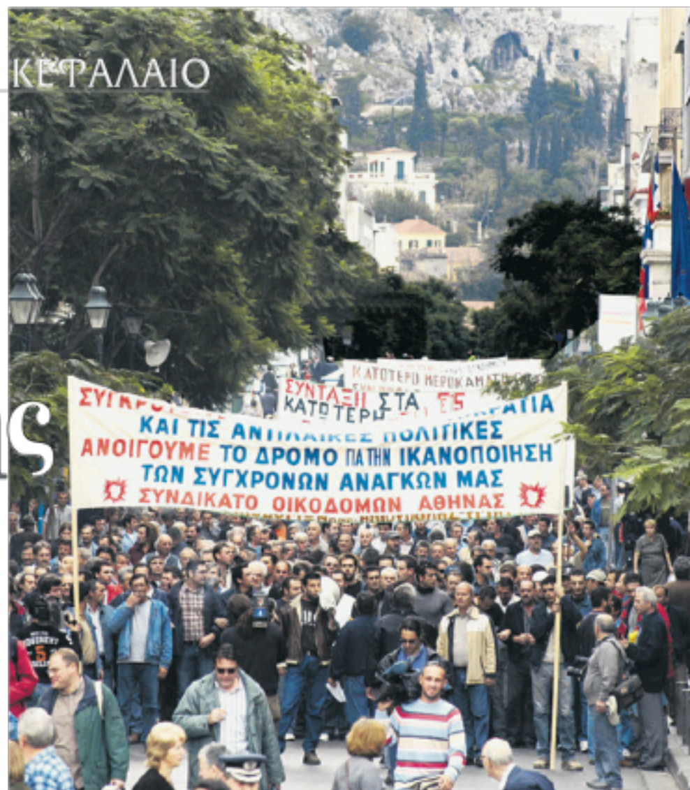
Το εργατικό κίνημα αγωνίζεται για την ικανοποίηση των σύγχρονων αναγκών των εργαζομένων και η κατασκευή φθηνής εργατικής κατοικίας είναι βασική αποστολή του Οργανισμού Εργατικής Κατοικίας

Αλήθεια, από πότε ο εκάστοτε δήμαρχος μπορεί να καθορίζει τη στεγαστική πολιτική του ΟΕΚ; Γιατί η Διοίκη-