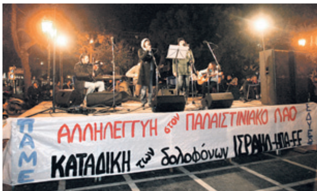
Στιγμιότυπο από τη συνανλία αλληλεγγύης στον παλαιστινιακό λαό, στην Αθήνα

• Όταν χρησιμοποιούνται τα λιμάνια μας για τη μεταφορά