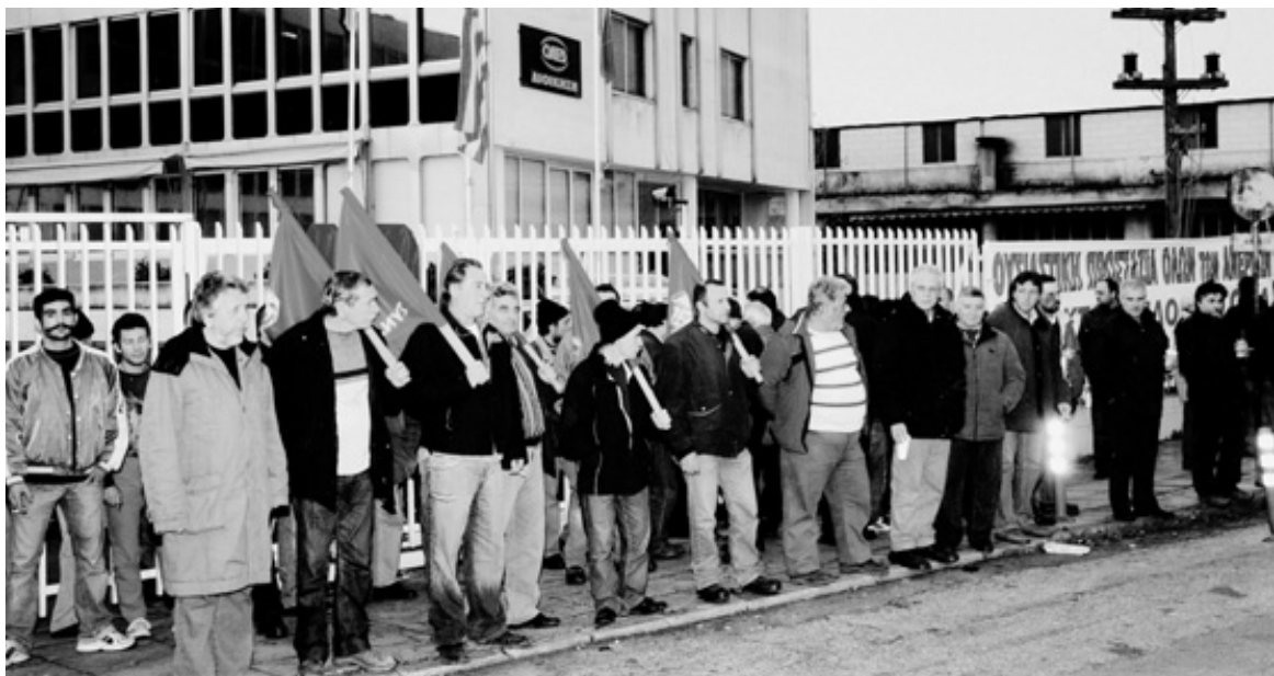
Στιγμιότυπο από τη διαδήλωση και την κατάληψη στα κεντρικά γραφεία του ΟΑΕΔ στον Αλιμο

Με τέτοιου είδους γελοία επιχειρήματα, προσπαθούν να αποτρέψουν την αγωνιστική αντίδραση των εργαζομένων και κυρίως των ανέργων, όταν κλέβουν το δικαίωμά τους για επιβίωση.