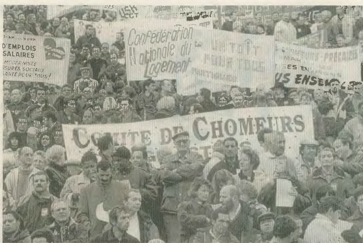
Ααθήλωση ανέγρον στο Παρίσι. Οι εργαζόμενοι της Ευρώπης γεύονται για να κιά τις συνέπειες της ΟΝΕ

Στα διορθωτικά μέτρα ανήκει και το άγριο