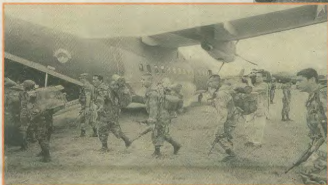
Ομάδα του στρατού επιβιβάζεται σε αεροπλάνο για να εξορμήσει κατά των ανταρτών, ενώ οι λαϊκές συγκεντρώσεις και οι απεργίες αποτελούν καθημερινά φαινόμενα

Οι ανταρτικές δυνάμεις ομοετέχουν στο Εθνικό Συντακτικό των Ανταρτών «Σιμόν Μπολιβάρ» από το όνομα του εθνικού ήρωα της χώρας. Το Συντακτικό δημιουργήθηκε το 1987, έλκεται το ένα τρίτο ποσοστό των εσόδων και έχει 12.000 ως