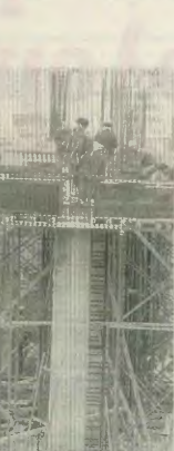
Το οικοδομικό κίνημα παλεύει για να αποκτήσουν πραγματική στέγη οι δικαιούχοι του ΟΕΚ και να έχουν στην κατοχή τους κερφόρα, εμπορική τράπεζα

εμπροσκή επίθεσή που θα διευκολύνει τη στέγη των εργαζομένων αυτών επιχειρήσεων, ανεξάρτητα αν υπάρχουν εισφορές, ενώ θα αποκλείει τους εργαζομένους που είναι οι πραγματικοί δικαιούχοι. Παράλληλα, οι εν λόγω επιχειρήσεις από τη μια θα θραιοποιούν και από την άλλη θα δένουν μη-υπόβλητους τους εργαζόμενους.