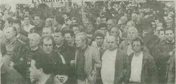
Στάχτη στα μάτια του κόχμου οι λεγόμενες μειώσεις έμμεσων φόρων, για να κρύψουν τις πραγματικές απώλειες των εργαζομένων

ΣΤΟΝ ΠΡΟΫΠΟΛΟΓΙΣΜΟ ΤΗΣ ΤΕΛΕΡΑ ΧΙΛΙΑΣ ΛΕΗΛΑΣΙΑ ΤΟΥ ΕΙΣΟΔΗΜΑΤΟΣ ΣΤΗΝ ΚΑΤΕΔΑΡΙΣΗ ΤΗΣ ΚΟΙΝΩΝΙΚΗΣ ΑΣΦΑΛ ΣΥΝΔΙΚΑΤΟ-ΠΙΚΟΔΟΜΩΝ-ΑΕΦΗΝΣ